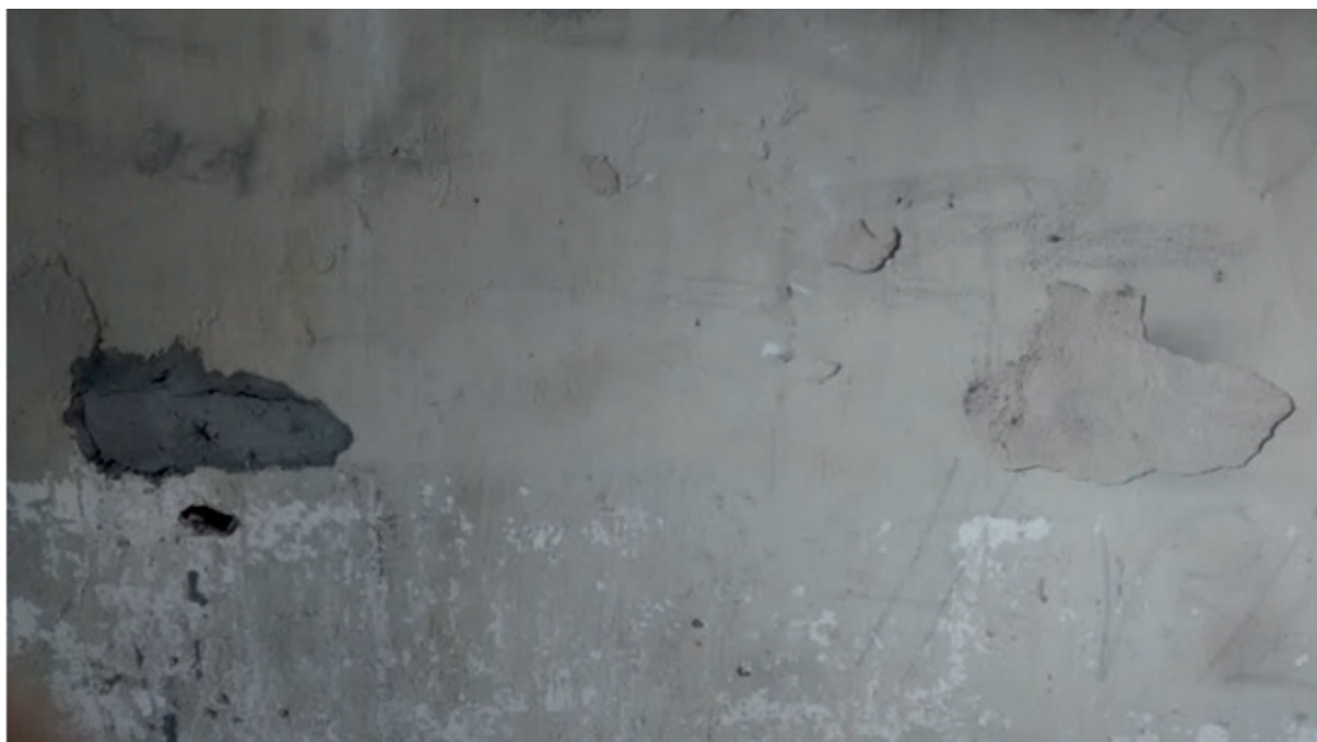
Figura 4. Desprendimento de reboco causado por umidade e falta de manutenção

Como podemos observar na Figura 1, de um modo geral a umidade afeta as paredes da construção, assim como é o caso da Figura 4. Baseados nas figuras, sugerimos o mesmo tratamento com um revestimento impermeabilizante para todas as paredes localizada à direita da Figura 1, que por ter contato direto com o talude se torna um local vulnerável à umidade.