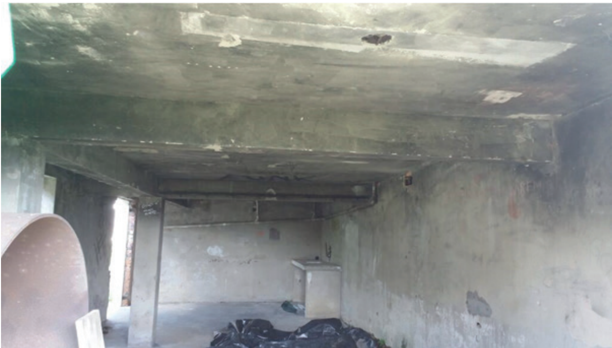
Figura 1. Vista geral do local