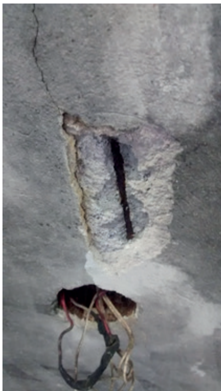
Figura 5. Armadura exposta

Na construção observamos vários pontos de armaduras expostas e com sinais de corrosão. A figura a seguir apresenta uma fissura na laje seguida de desprendimento de uma placa de concreto, deixando a armadura exposta, provavelmente causada por umidade.