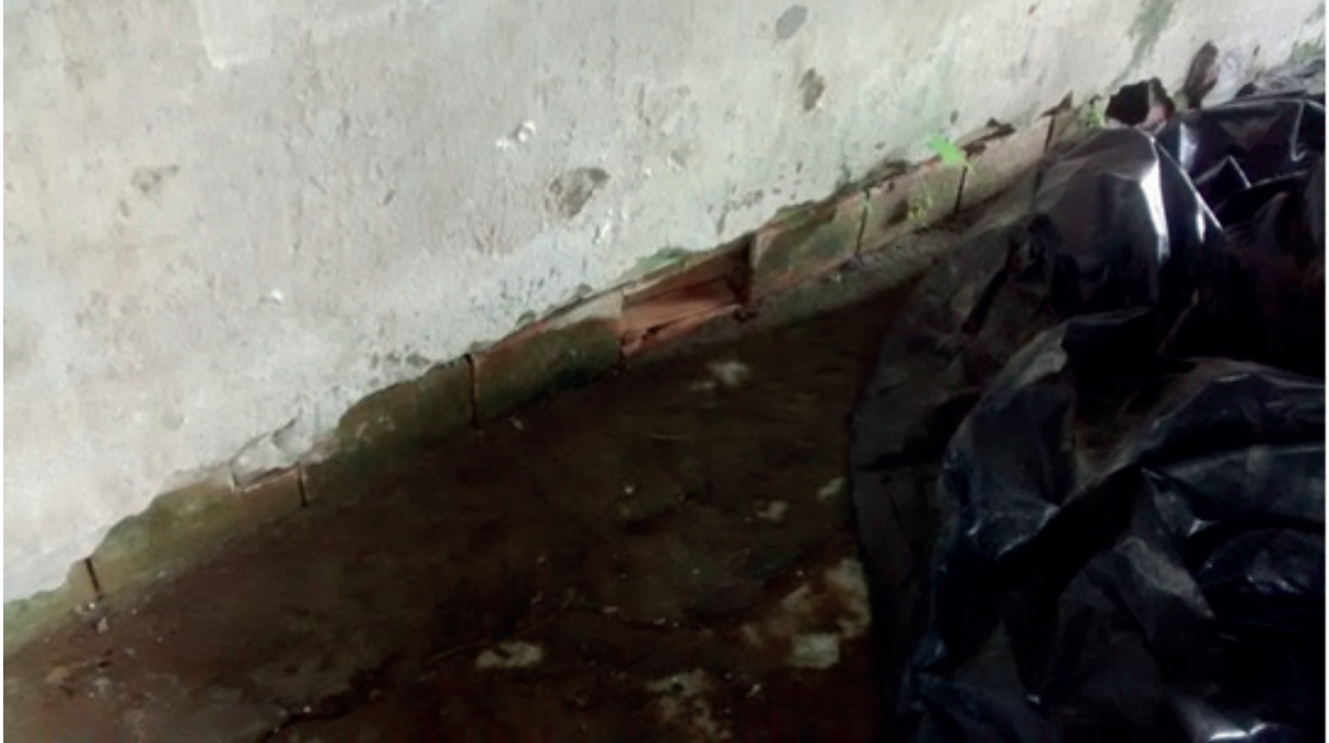
Figura 2. Piso com infiltração

Na figura a seguir podemos observar que algum tipo de infiltração está causando umidade excessiva no piso e vestígio de umidade na parede. Em primeiro lugar iremos identificar o que está causando esta umidade, se é uma infiltração interna ou externa, interna se for o caso de alguma tubulação que tenha se rompido, ou externa se for proveniente de água de chuva.