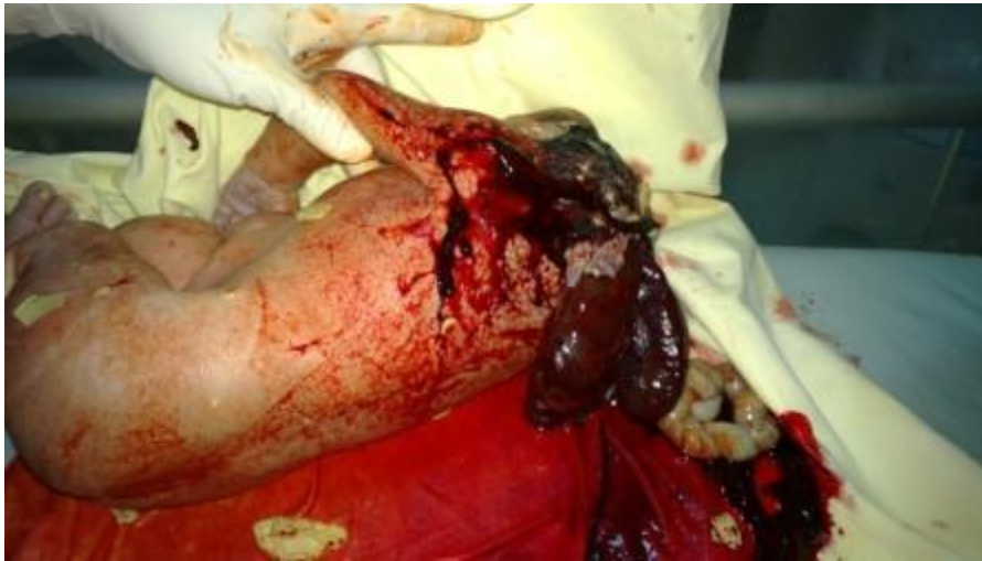
Fig. 3. Se observa feto acráneo con masa disforme en la proyección cefálica posterior.

Se realiza cesárea obteniéndose feto único acráneo, sexo masculino, peso de 3000gs, talla 48 cms (Figuras 3 y 4).