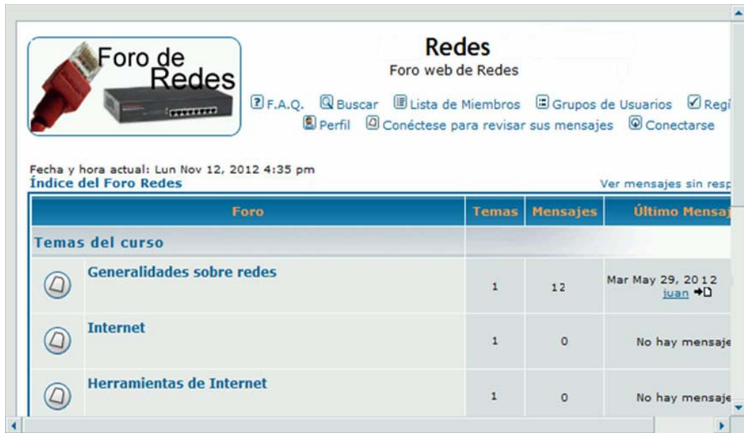
Fig. 2 Foro Web de Redes.

Se dispone de un sistema de ejercicios distribuidos por módulos con interesantes y motivadores ejercicios, los cuales posibilitan comprobar las respuestas emitidas por los usuarios, ofreciéndose una evaluación de forma automática; el simulador de redes es una potente herramienta que posibilita simular diferentes diseños de redes con distintos niveles de complejidad donde el estudiante puede realizar y observar cómo ocurren los procesos simulados "paso a paso" potenciando una mejor comprensión del contenido (figura 3).