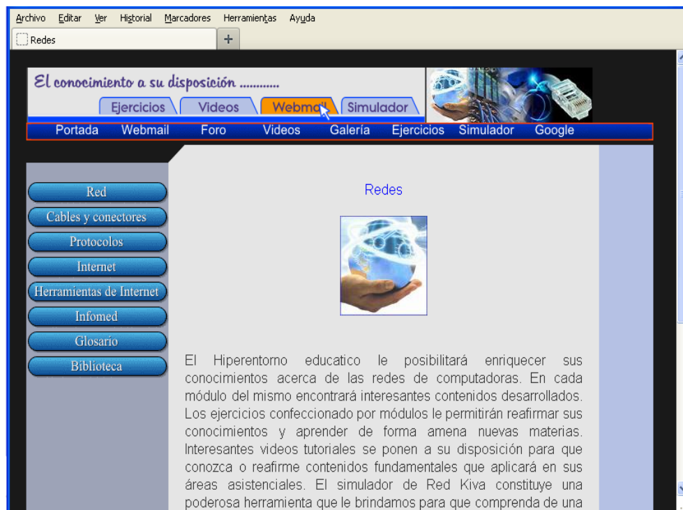
Fig. 1 Pantalla Principal del Hiperentorno.

El hiperentorno cuenta con una pantalla principal (figura 1) de la cual se puede acceder al resto de las páginas que componen el software, a través de los distintos hipervínculos preestablecidos. Se ofrecen materiales de apoyo a la docencia estrechamente vinculados con los distintos contenidos abordados en los temas de la asignatura.