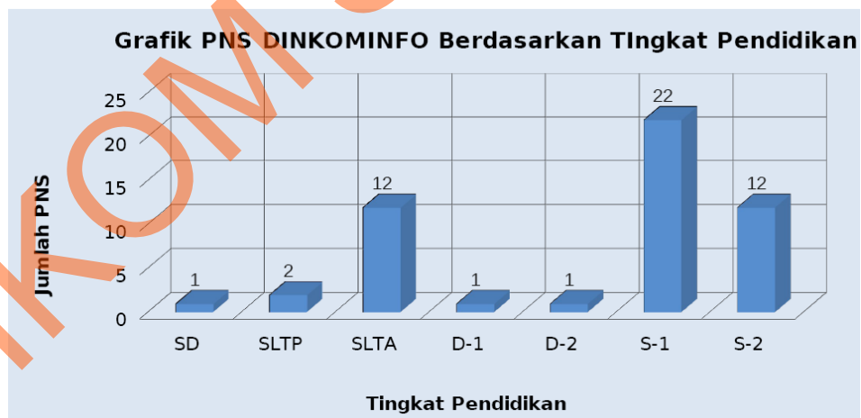
Gambar 2.2 Grafik PNS Dinkominfo Berdasarkan Tingkat Pendidikan ( dinkominfo.surabaya.go.id )