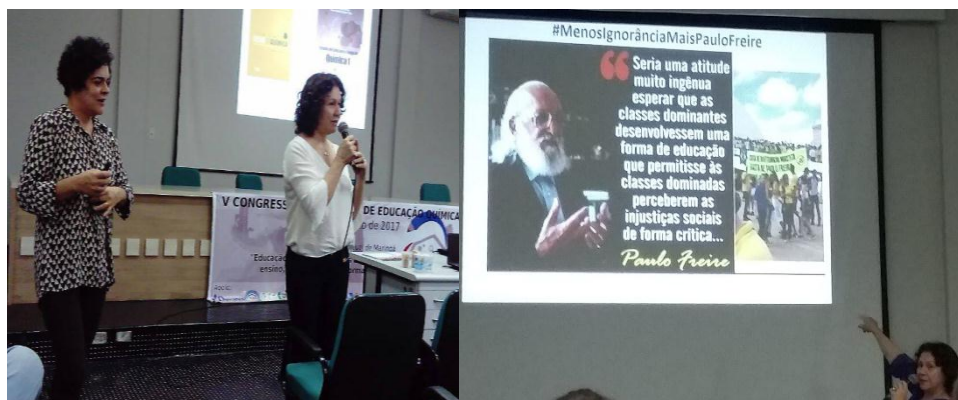
Figura 02: Da esquerda para a direita: Palestra e Mesa Redonda