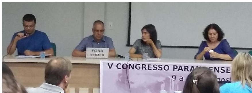
Figura 01: Mesa Redonda 2 - Reflexões acerca do pensamento crítico no contexto educacional