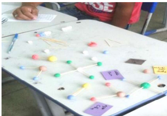
Figura 1: Estruturas montadas pelos alunos do primeiro ano.

Inicialmente, os estudantes foram reunidos em 4 grupos (com 3, 4,4 e um com 5 alunos), e ainda tivemos a colaboração de 3 alunos do segundo ano que serviram de monitores para auxiliarem na realização das atividades. Foram estabelecidas as regras da atividade com os estudantes, conforme descrito. A figura 1, apresenta algumas estruturas que estavam sendo montadas pelos estudantes, no momento de aplicação da atividade; foi possível notar que eles ficaram atentos e dialogavam entre si, chamando a professora ou uma das alunas ID para questionar e verificar suas ideias, nas diversas situações em que eram desafiados: