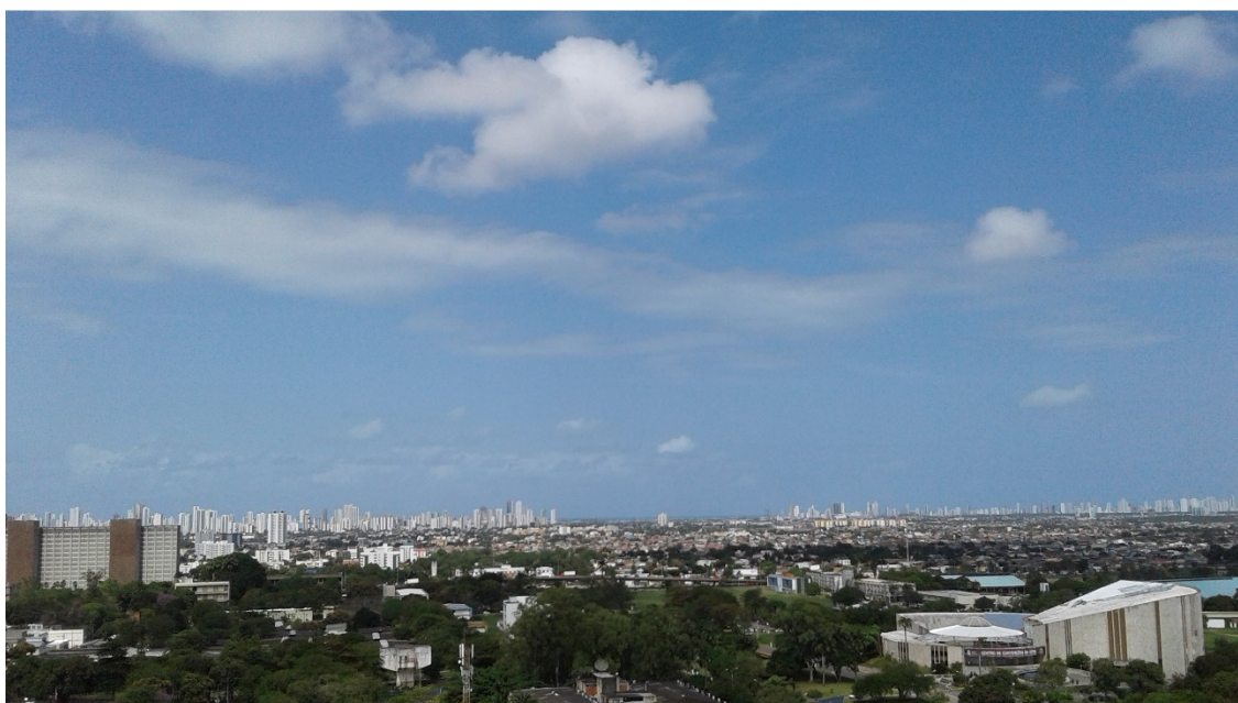
Figura 2. Recife: paredão de construções verticais ao longo da zona costeira.

No caso específico da cidade de Recife, a forte densidade das construções de imóveis verticais, na cidade, principalmente quando realizada no sentido N-S, isto é, ao longo da zona costeira da cidade (Figura 2), vem cada vez mais formando uma extensa barreira linear à circulação natural dos ventos marítimos. O que, por sua vez, acontece acelerando a situação da expansão dos espaços de ilha de calor, acarretando, sobretudo nas zonas mais centrais da cidade, significativa mudança em termos de temperatura e fluxo de circulação dos referidos ventos.