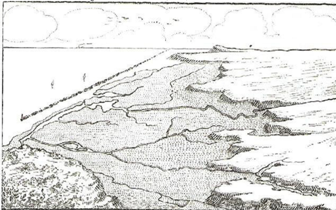
Figura 1. Recife: sítio urbano original.

De acordo com a Figura 1, vê-se que a planície flúvio-marinha do Recife, cuja origem se