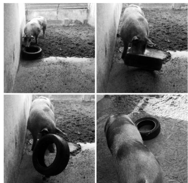
Figura 2. Sequência de interesse e desinteresse de cachaços em relação ao pneu utilizado como enriquecimento ambiental.