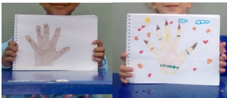
Imagem 1: Atividade: Minha cor de pele