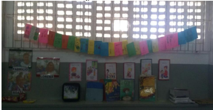
Imagem 2: Fanzines