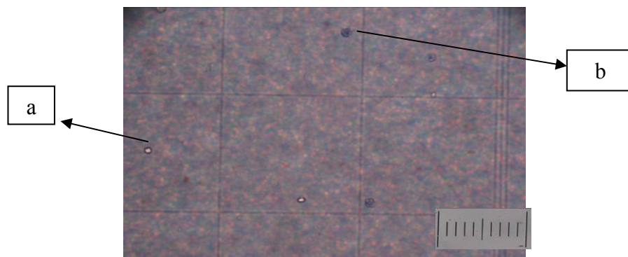
Gambar 1. Morfologi sel mieloma dengan pewarnaan trypan blue ; (a) sel hidup; (b) sel mati; (bars = 100 \mu m)

Berdasarkan hasil penelitian menunjukkan bahwa trypan blue hanya akan memasuki membran sel yang rusak (sel mati), sehingga sel mati akan mengembang dan berwarna biru tua. Integritas membran sel mati menurun sehingga tidak permeabel lagi terhadap berbagai senyawa yang masuk. Sel hidup (viabel) tetap berukuran normal, bulat, berpendar dan tidak berwarna biru (Gambar 1). Jarak antara pewarnaan dengan perhitungan sel dilakukan tidak kurang dari 3 menit dan maksimal selama 10 menit. Jika terlalu lama maka sel yang hidup juga akan berwarna biru sehingga hasilnya menjadi positif palsu [Freshney, 1987].