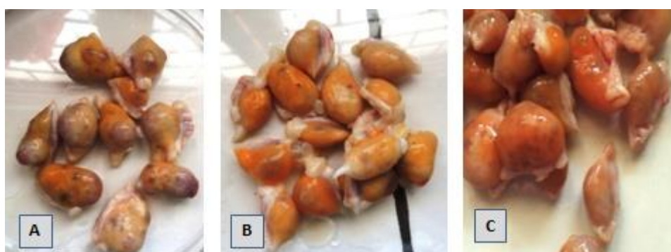
Gambar 1. Ovarium sapi Bali-Timor (a) Ovarium dengan corpus luteum (b) Ovarium dengan folikel dominan (c) Ovarium tanpa corpus luteum maupun folikel dominan.

luteum tanpa folikel dominan. Kehadiran corpus luteum pada pasangan ovarium akan memberikan korelasi positif terhadap jumlah folikel (Boediono et al. 1995). Corpus luteum menghasilkan progesteron yang dapat menghambat pertumbuhan folikel dominan mencapai ovulasi sehingga akan mengurangi pengaruh negatif dari inhibin dan estradiol yang dihasilkan oleh folikel dominan dalam menghambat pertumbuhan folikel subordinat, sehingga jumlah folikel subordinat yang tumbuh menjadi lebih banyak pada pasangan ovarium yang memiliki corpus luteum dari pada ovarium yang memiliki folikel dominan.