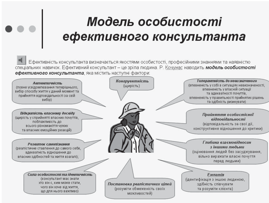
Рис. 3. Когнітивна карта моделі особистості ефективного психолога-консультанта

5. Структурний елемент «Вправи до теми» містить тестові завдання для перевірки первинного засвоєння аудіо-візуальної презентації лекції: тести на суміщення, встановлення відповідностей між поняттями та ознаками, класифікації тощо (рис. 4).