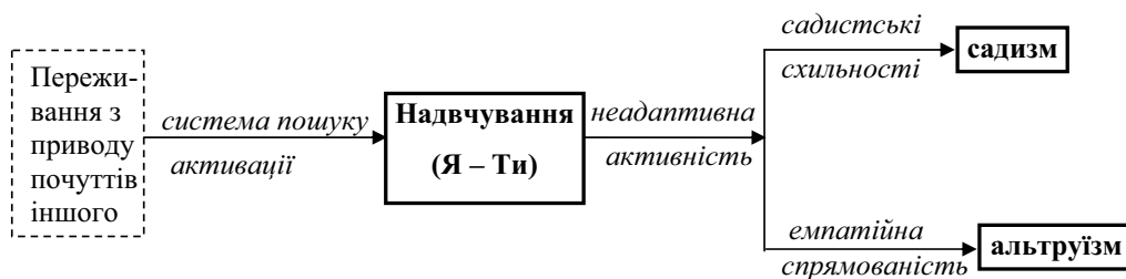
Рис. 2. Динаміка трансфінітної емпатії

Надчуттєве проникнення суб'єктів забезпечується дуже складною системою механізмів, які ще не вивчені сучасною психологією. Спрощено-схематично процес трансфінітної емпатії подано на рис. 2.