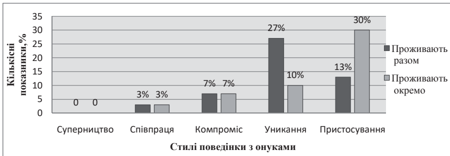
Рис. 3. Розподіл стилів поведінки людей похилого віку в конфліктних ситуаціях з онуками

це люди поважного віку, їхній стан здоров'я не завжди дає можливість бути активними, самостійно задовольняти всі свої потреби, тому вони відчують деяку залежність від молодого покоління, особливо від своїх дітей і тому не бажають погіршувати з ними стосунки, конфлікти прагнуть згладити або пристосуватися до ситуації, яка склалася.