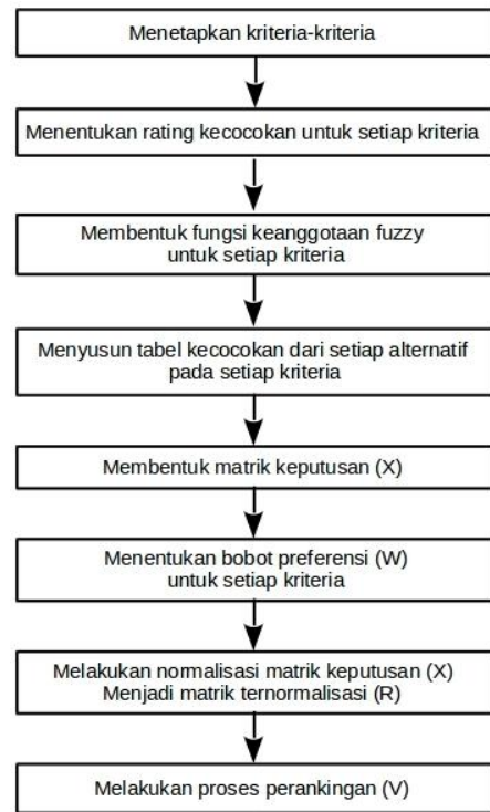
Gambar. 1 Tahapan FMADM

Berikut tahapan-tahapan dalam pengambilan keputusan menggunakan FMADM