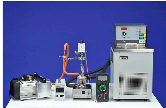
Abb. 3: Dieses IBE ermöglicht ohne jede Gefahr die Untersuchung des Zusammenhangs zwischen Druck und Temperatur einer toxischen Flüssigkeit. Die Geräte des Aufbaus lassen sich über realitätsbezogene Gesten bedienen, alle relevanten Vorgänge multimodal wahrnehmen und Messwerte in Echtzeit ablesen.

Im Falle einer Schwangerschaft sind Studentinnen oft gezwungen, Praktika bis zum Ende der Stillzeit zu unterbrechen. Experimente in Laborfächern, bei denen häufig auch mit toxischen Präparaten hantiert wird, stellen dann ein grundsätzliches Tabu dar. IBE ermöglichen es, ohne toxische Belastungen und zeitlich flexibel, reale Experimente vom Heimarbeitsplatz aus virtuell nachvollziehbar zu machen. In Kooperation mit Lehrenden aus den Fachgebieten Chemie, Biologie, Veterinärmedizin und Physik wurden IBE problematischer Experimente erstellt, die über das Learning Management System der Freien Universität Berlin zu folgenden Themen jederzeit und überall verfügbar sind. Ein erster Schritt zur Flexibilisierung der Praktika [22].