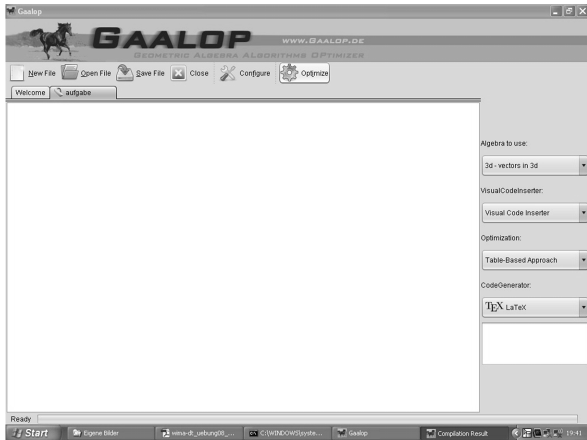
Abb.8: Kopiervorlage der an die Studierenden ausgegebenen OHP-Folie.