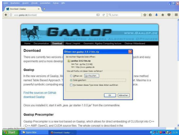
Abb.3: Download des Programm-Tools GAALOP.

An Anschluss an die Bearbeitung und Einübung der Lösung Linearer Gleichungssysteme mit zwei Unbekannten von Hand wurden die gleichen Übungsaufgaben mit Hilfe von GAALOP bearbeitet [41, AB 9, Aufg. 3], [42, AB 9, Aufg. 3]. Die dabei durch die Studierenden gewonnene Selbstsicherheit im Umgang mit GAALOP stellt eine wichtige Voraussetzung für ein erfolgreiches Anwenden von GAALOP bei der Bearbeitung und Lösung von Linearen Gleichungssystemen mit drei oder mehr Unbekannten dar.