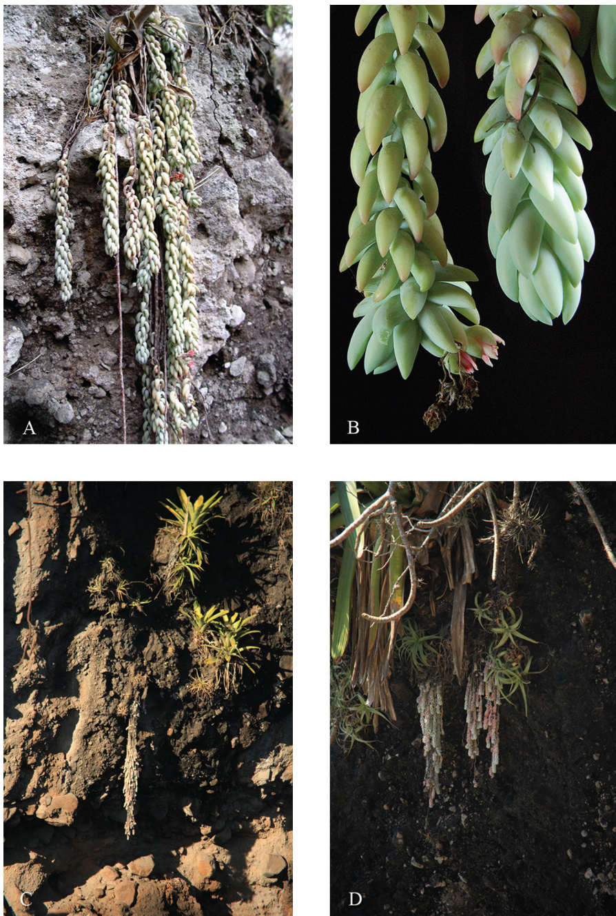
Fig. 2. Sedum morganianum . A. hábito; B. detalle de la inflorescencia; C. y D. hábito.