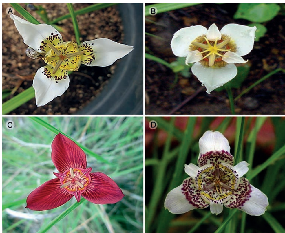
Fig. 4. Flores de especies relacionadas a Tigridia hintonii . A. T. chiapensis ; B. T. mexicana ssp. passiflora ; C. T. mortonii ; D. T. tepoxtlana .

Debido a las características de sus nectarios, es posible ubicar a Tigridia hintonii en el subgénero Tigridia propuesto por Molseed (1970). Esta especie es morfológicamente similar a T. mexicana ssp. passiflora Molseed (Fig. 4b), la cual presenta tépalos blancos con manchas pardas en la base. La diferencia entre ambos taxones es la presencia de hojas durante la antesis y la reducción de la parte distal de los tépalos internos en T. hintonii . Molseed (1970) relacionó a T. hintonii