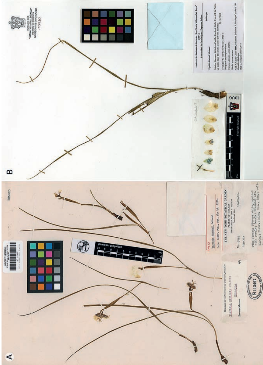
Fig. 2. Ejemplares de herbario de Tigridia hintonii Molseed. A. ejemplar tipo ( G. B. Hinton 9748 (holotipo: UC!, 1113497)); B. ejemplar colectado ( A. Castro-Castro et al. , 3089 (IBUG, IEB, MEXU)).