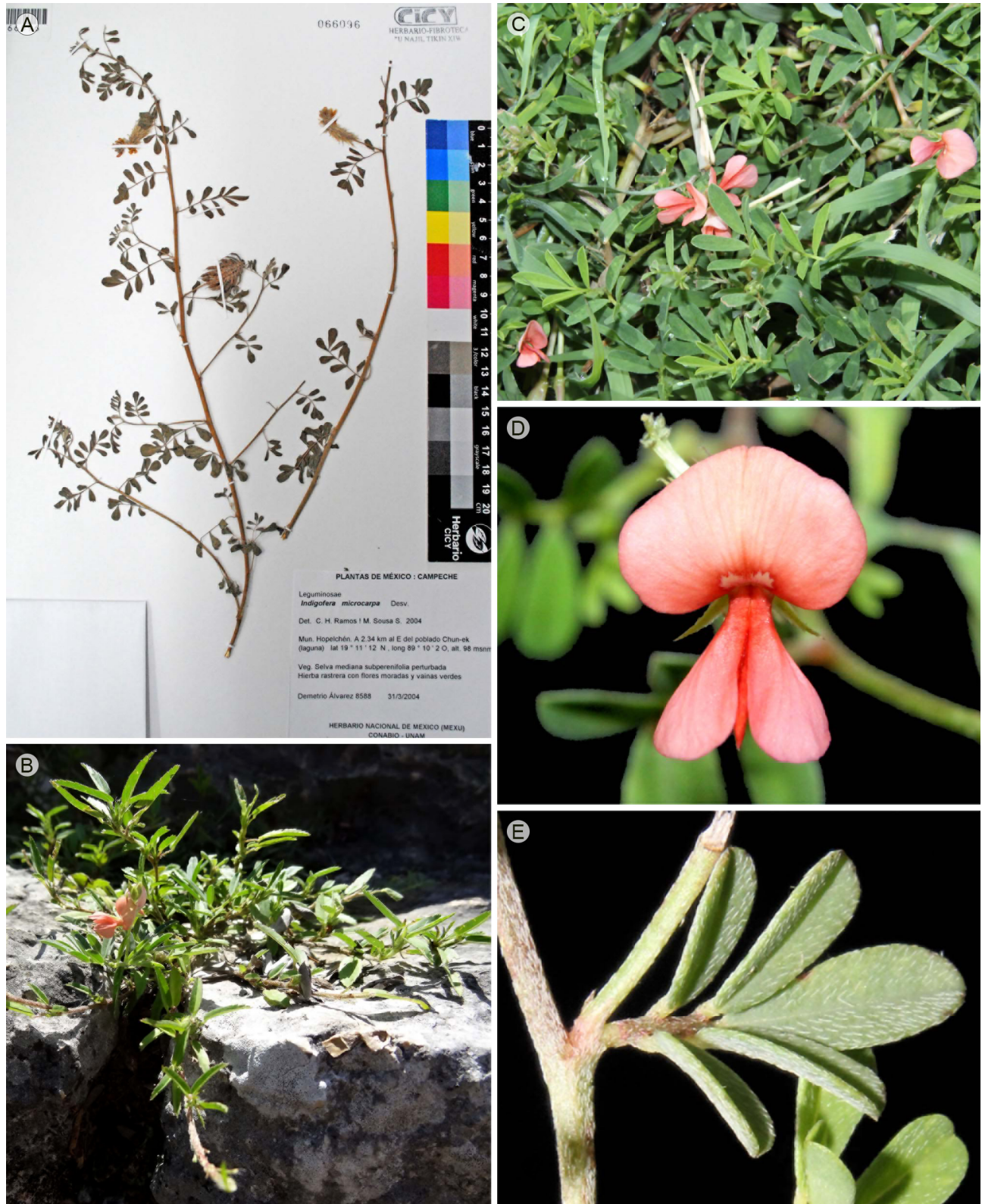
Figura 2: Nuevos registros de Indigofera L. para la Península de Yucatán, México. A. Indigofera microcarpa Desv. (D. Álvarez 8588, CICY); B-E. Indigofera miniata Ortega, B. planta en hábitat rupícola en la Zona Arqueológica de Dzibichaltun, C. planta en jardines de Campeche, D. flor, vista anterior, E. detalle de los tallos y hojas.