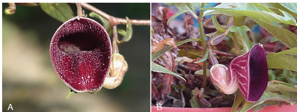
Fig. 2. Flor de Aristolochia emiliae vista de frente (A) y de costado (B).

lóbulos de 1-1.5 mm de largo, estípites de 0.5-1 mm de largo, estambres 5, anteras de 1.5-2 mm de largo, 1 mm de ancho; fruto una cápsula ovoide 5-carpelar, piloso, de 2-3 cm de largo, 1.7-2.5 cm de diámetro, dehiscencia basicaida, semillas triangulares, numerosas, negras, de 5-6 mm de largo, 4.5-5.5 mm de ancho, 1 mm de grueso, superficie finamente tuberculada.