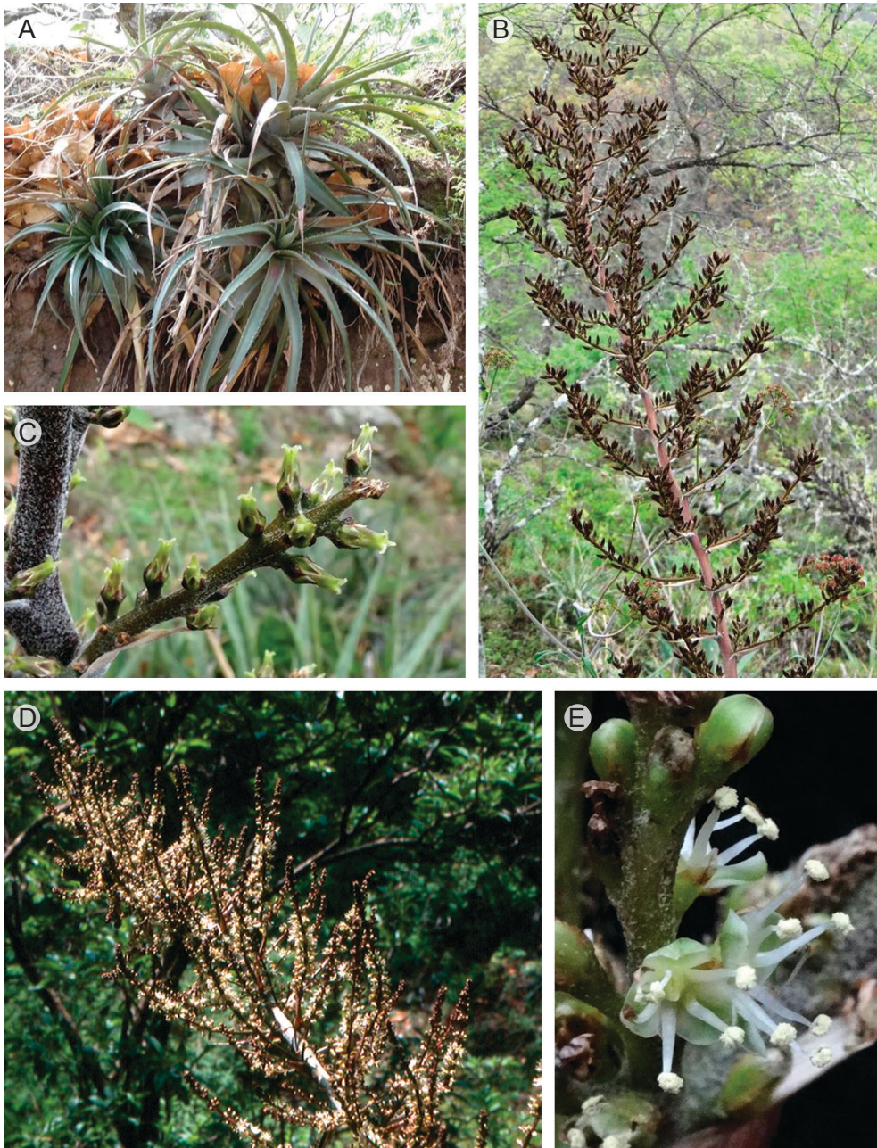
Fig. 1. Hechtia montis-frigidum González-Rocha, Espejo, López-Ferr. et Cerros-Tlatilpa. A. Rosetas. B. Inflorescencia con frutos maduros. C. Rama primaria con flores femeninas. D. Inflorescencia masculina. E. Flores masculinas.