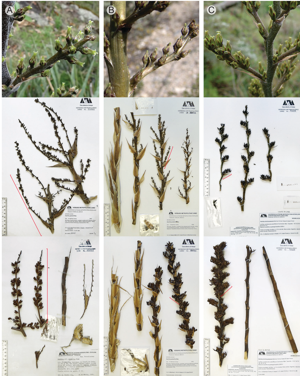
Fig. 4. Inflorescencias femeninas. A. H. montis-frigidi González-Rocha, Espejo, López-Ferr. et Cerros-Tlatilpa (A. R. López-Ferrari 2205; frutos, A. Bonfil 234). B. H. podantha Mez (A. Espejo 6889; frutos, N. Martínez C. 38). C. H. chichinaultzensis Martínez-Correa, Espejo et López-Ferr. (N. Martínez C. 39; frutos, N. Martínez C. 104).