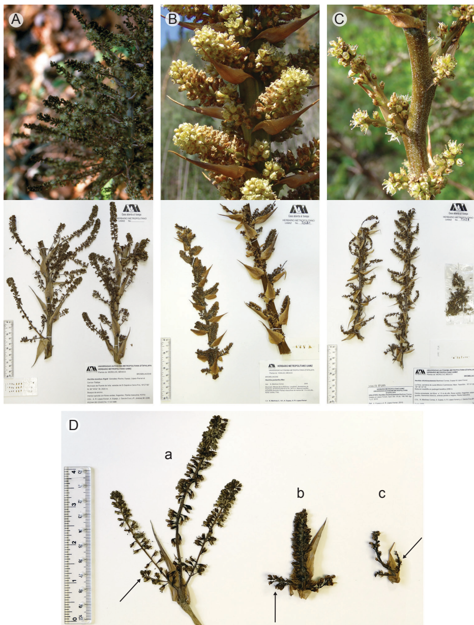
Fig. 3. Inflorescencias masculinas. A. H. montis-frigidi González-Rocha, Espejo, López-Ferr. et Cerros-Tlatilpa (A. R. López-Ferrari 2206). B. H. podantha Mez (N. Martínez C. 101). C. H. chichinautzensis Martínez-Correa, Espejo et López-Ferr. (N. Martínez C. 37). D. Ramas primarias: a) 3 veces ramificadas de H. montis-frigidi ; 2 veces ramificadas de b) H. podantha ; c) H. chichinautzensis .