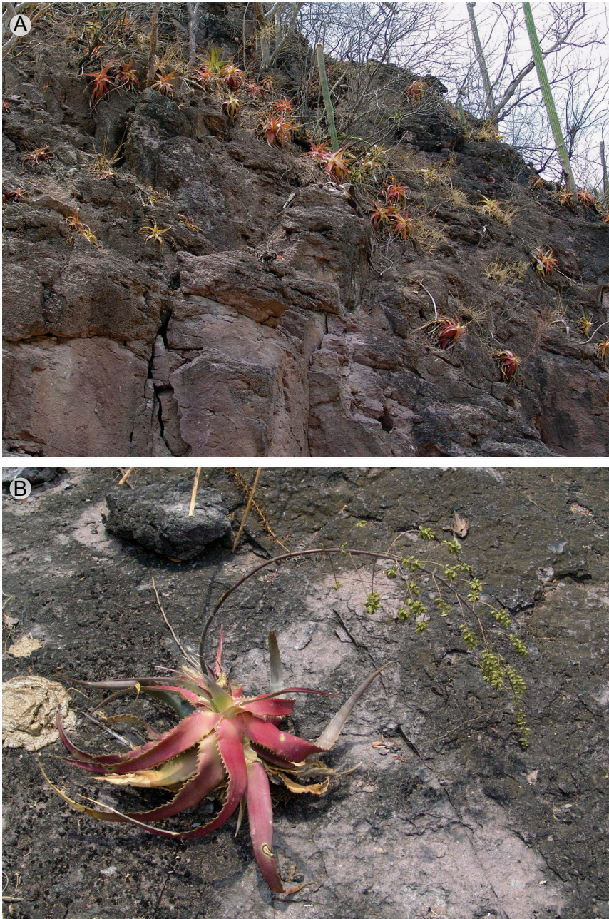
Fig. 1. Hechtia rubicunda López-Ferr. & Espejo. A. habitat; B. planta femenina.