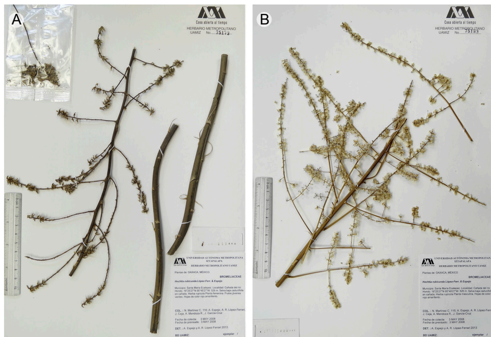
Fig. 4. A. Holotipo de Hechtia rubicunda López-Ferr. & Espejo; B. Paratipo de H. rubicunda López-Ferr. & Espejo.

R. y J. García-Cruz 115 , planta masculina (IEB, MEXU, SERO, UAMIZ) (Fig. 4 B); cañada Tejón, río Otate, 16°14'15" N, 95°53'34" W, 850 m s.n.m., selva baja caducifolia, 9.V.1993, P. Tenorio L. 18866 , planta femenina (MEXU).