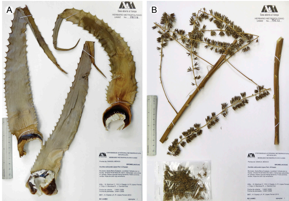
Fig. 3. A. y B. Holotipo de Hechtia rubicunda López-Ferr. & Espejo.

Paratipos: MÉXICO, Oaxaca, distrito de Yautepec, municipio de San Carlos Yautepec, 13.5 km al NNE de Río Hondo, brecha a Asunción Lachixonace, 16°29'48" N, 95°49'40" W, 750 m s.n.m., 17.V.1995, A. Salinas T. y E. Martínez-Correa 8176 , planta masculina (IEB, MEXU); municipio de Santa María Ecatepec, cañada del río Hondo, selva baja caducifolia en cañada, 16°25'27" N, 95°49'27" W, 526 m s.n.m., 3.V.2008, N. Martínez-Correa, A. Espejo, A. R. López-Ferrari, J. Ceja, A. Mendoza