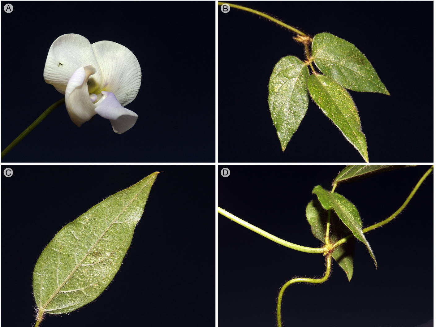
Figura 2: Vigna vexillata (L.) A. Rich. A. flor de la planta en su hábitat; B. hoja trifoliolada con borde entero y abundante pubescencia; C. detalle de un foliolo por el envés; D. detalles del tallo y punto de inserción de la hoja.

tante eficientes (Díaz-Suárez y Ríos-Albuerne, 2017) y aseguran la dispersión a cierta distancia de la planta madre (Wilson, 1981). Se reportan diferentes usos para la especie como el medicinal, forrajero, control de erosión y comestible (raíz) (Beyra y Reyes-Artiles, 2004; GRIN-GLOBAL, 2006; Karuniawan et al., 2006).