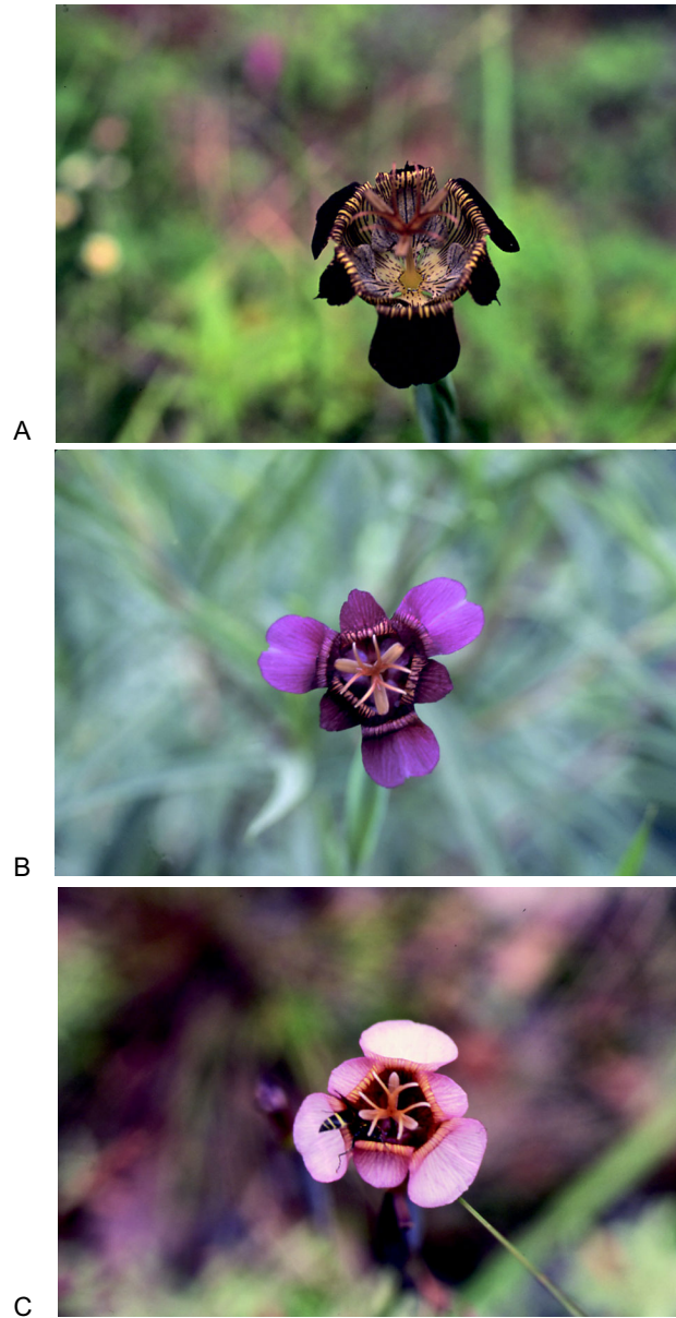
Fig. 2. A. Tigridia potosina López-Ferrari & Espejo (ejemplar testigo: A. Espejo et al. 5134 (UAMIZ)); B. Tigridia multiflora (Herb.) Ravenna (ejemplar testigo: A. R. López-Ferrari et al. 2289 (UAMIZ)); C. Tigridia multiflora (Herb.) Ravenna (ejemplar testigo: A. R. López-Ferrari et al. 2031 (UAMIZ)).