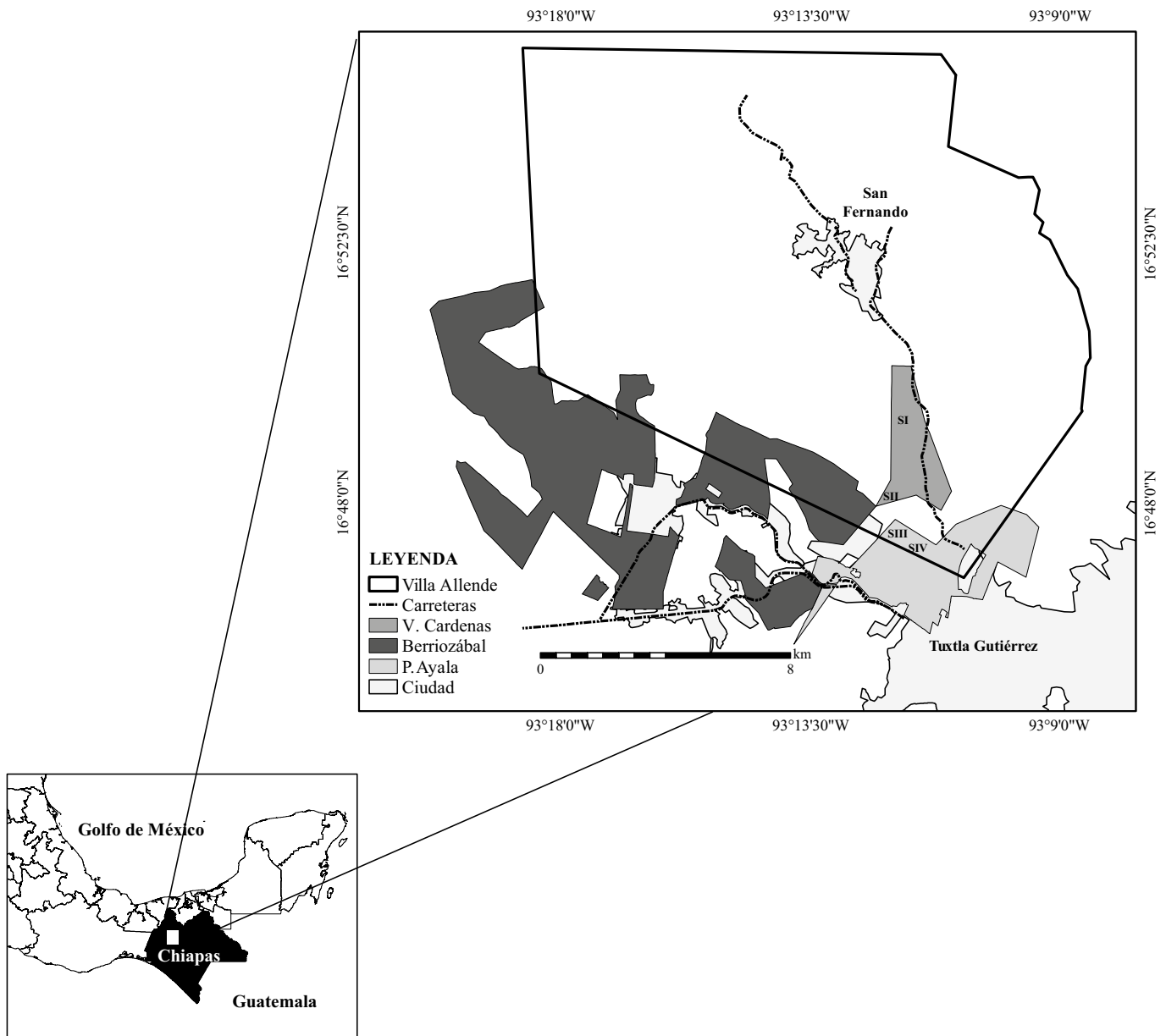
Figura 1: Localización de las comunidades de estudio en la Reserva Forestal Villa Allende, Chiapas, México, y los sitios de muestreo en campo (S).

Plan de Ayala está dentro del área urbana de la ciudad de Tuxtla Gutiérrez (capital del estado de Chiapas), entre 16°45'N, 93°10'O, a una altitud de 594 m. Posee una superficie ejidal de 1034.03 ha, distribuidas en 199.18 ha de uso agrícola, 648.8 ha de bosque secundario y 236.05 ha de zona urbana.