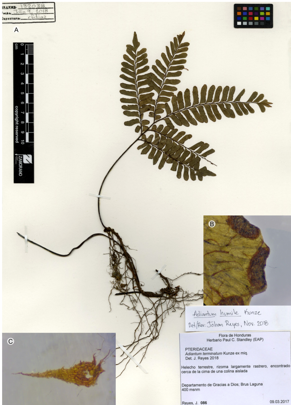
Figura 2: Adiantum humile Kunze. Muestra herborizada, A. rizoma largamente rastrero y pinnulas; B. indusio; C. escamas del rizoma clatradas y denticuladas. J. Reyes 86 (EAP).