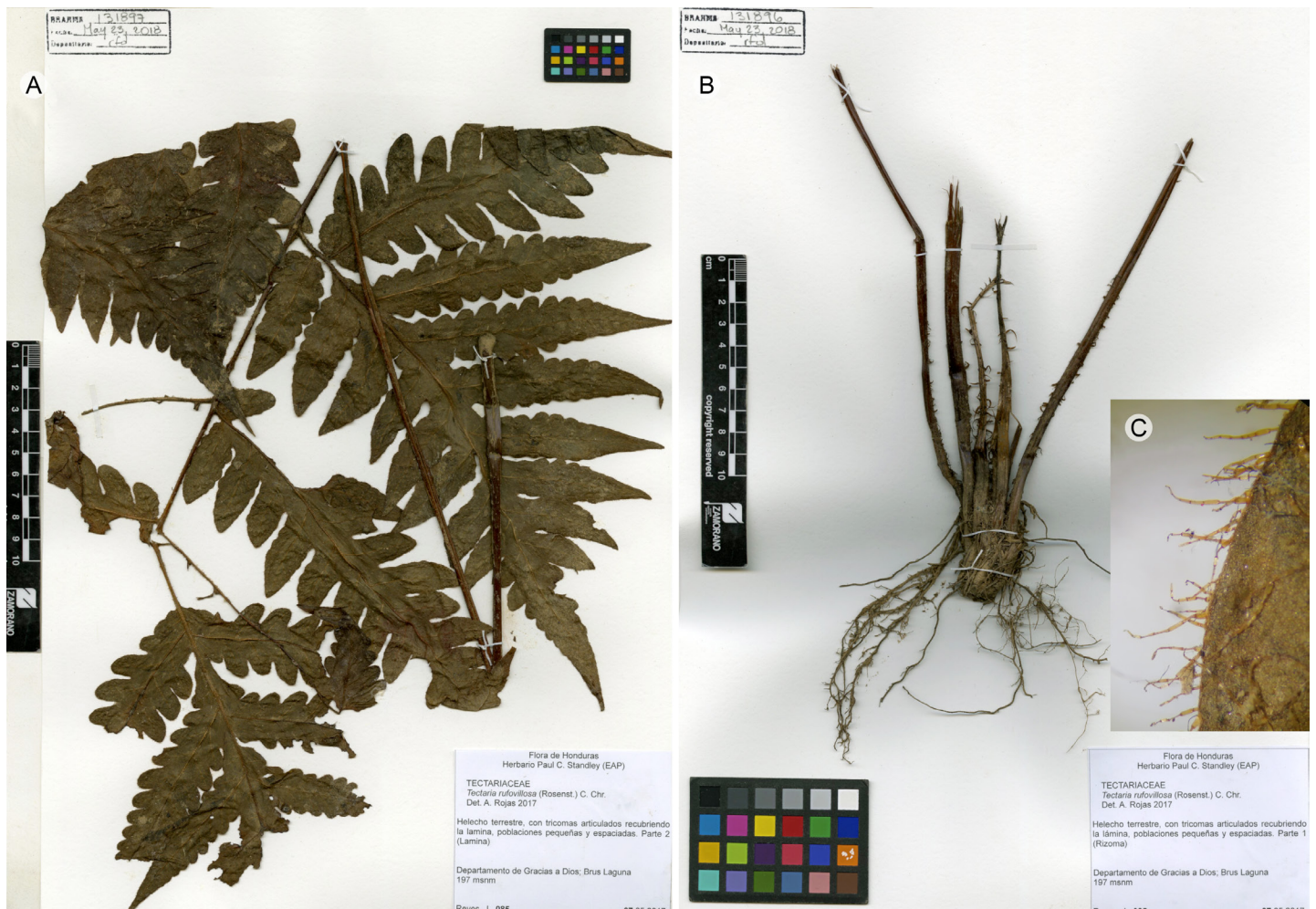
Figura 4: Tectaria ruvifilosa (Rosenst.) C. Chr. Muestra herborizada. A. lámina; B. rizoma y escamas; C. tricomas articulados. J. Reyes 85 (EAP).

especies, no se registra en Honduras. No obstante, dos especies de este grupo ( Cyathea austroamericana Domin y Cyathea grayumii Rojas) sí lo están, por lo que al no estar citado el material correspondiente a la reserva, no se puede verificar cuál de estas estaría presente y se decide dejar el nombre Cyathea multiflora como sinónimo.