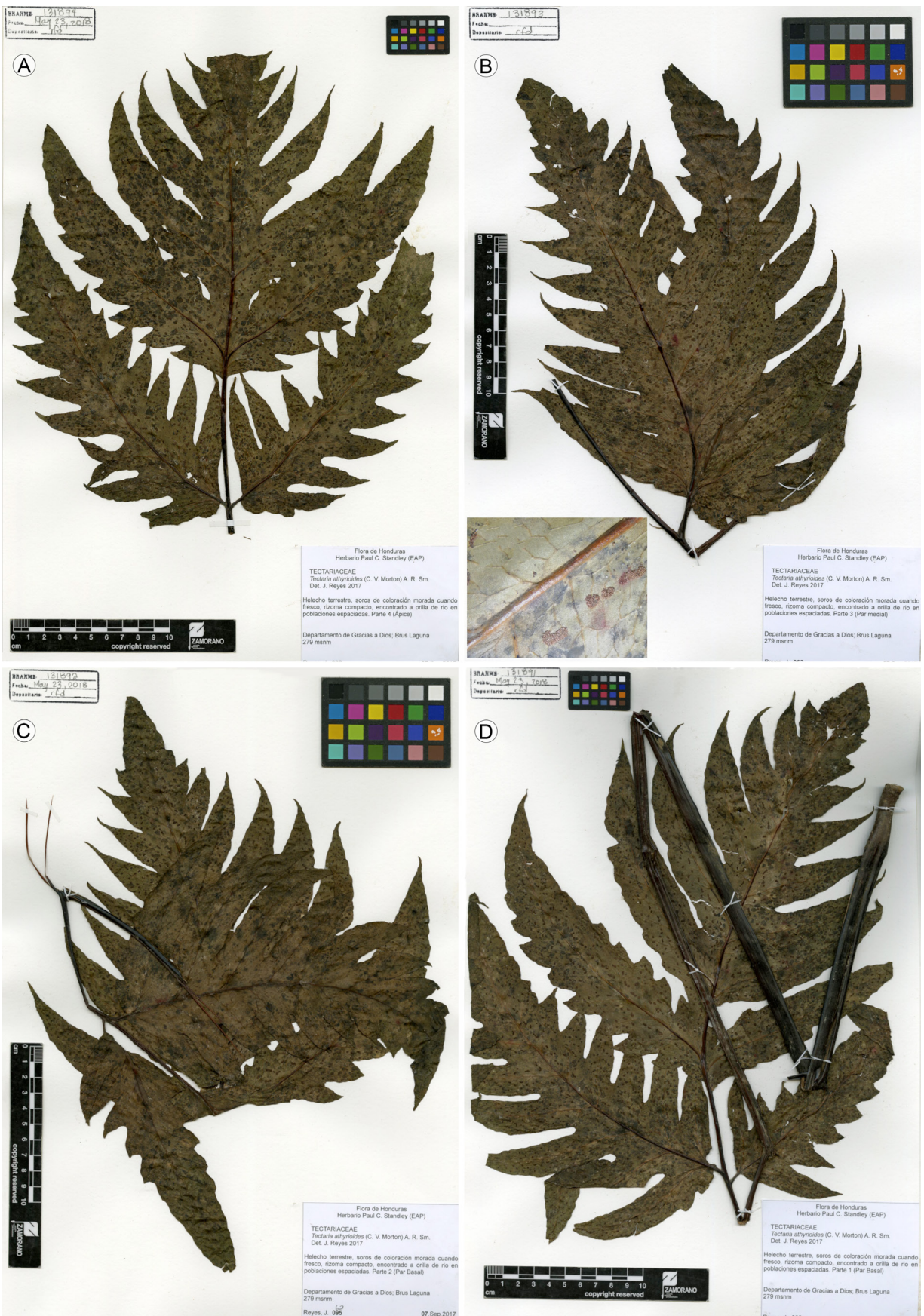
Figura 3: Tectaria athyroides (Baker) C. Chr. Muestra herborizada. A. ápice; B. pinnas mediales; C. soros en forma de J; D. pinna basal izquierda; E. pinna basal derecha y raquis. J. Reyes 95 (EAP)