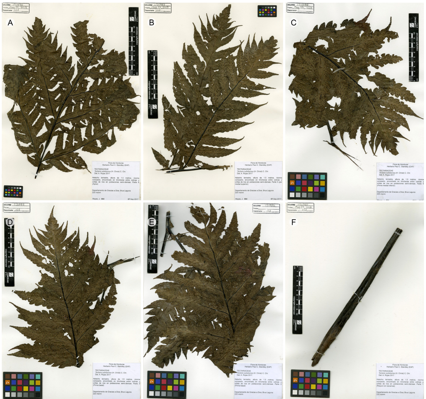
Figura 5: Tectaria subebenea (Christ) C. Chr. Muestra herborizada. A. ápice; B. pinnas superiores; C. pinnas mediales; D. pinna basal izquierda; E. pinna basal derecha; F. raquis. J. Reyes 64 (EAP).

de la frontera agrícola y ganadera, la construcción de represas hidroeléctricas y la apertura de caminos y carreteras. Estas amenazas pudieron ser observadas durante los vuelos a la zona de estudio y debido a las visitas prolongadas, mostraron en un año un avance descontrolado de la frontera agrícola que amenaza con destruir estos ecosistemas.