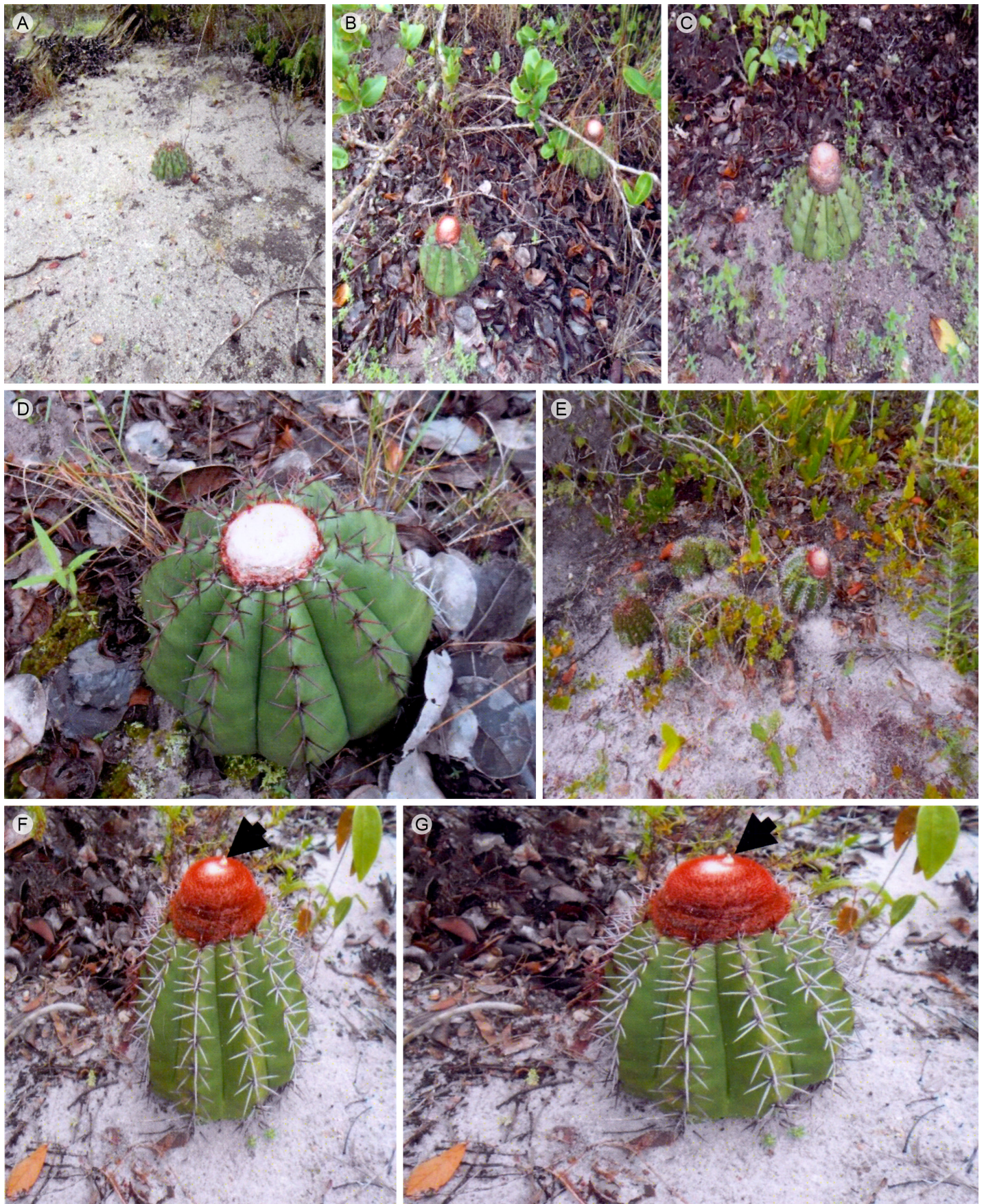
Figura 3: Hábito de Melocactus violaceus Pfeiff. subsp. margaritaceus N.P. Taylor en las dos zonas de estudio. A-C. Mata Atlántica: Parque Nacional Sierra de Itabaiana; E-G. restinga: Playa de Pirambu, Sergipe, Brasil.