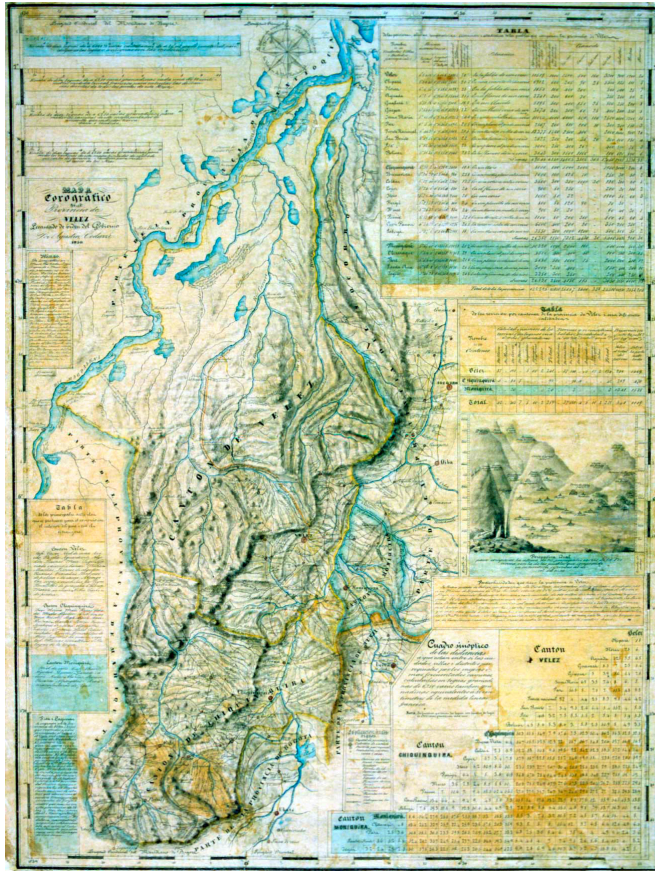
FIGURA N° 2. Provincia de Vélez, 1850.

Ahora bien, el carácter de los habitantes de la provincia, que posteriormente habría de componer al hoy llamado Departamento de Santander, se caracteriza por ser un temperamento fuerte e independiente, ello, a consideración de algunos historiadores, debido a su ascendencia étnica y su agreste medio ambiente: “Por siglos el santandereano, descendiente de asturianos, navarros y vascos, con escaso mestizaje de aguerrido elemento indígena, permaneció prácticamente aislado en una región formada por cañadas profundas y reducidos valles, lo cual fue formando su carácter individualista, al tener que valerse por sí mismo en la pobreza de su medio” . 4