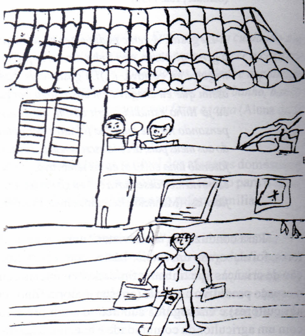
Trabalho no comércio. Produção de alunos da escola rural, Boqueirão, Caucaia; CE, 1995.

Eis o texto e as imagens decorrentes dessa vivência: