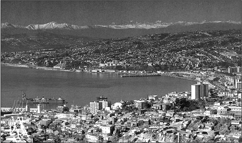
FOTO 1. Ciudad de Valparaíso