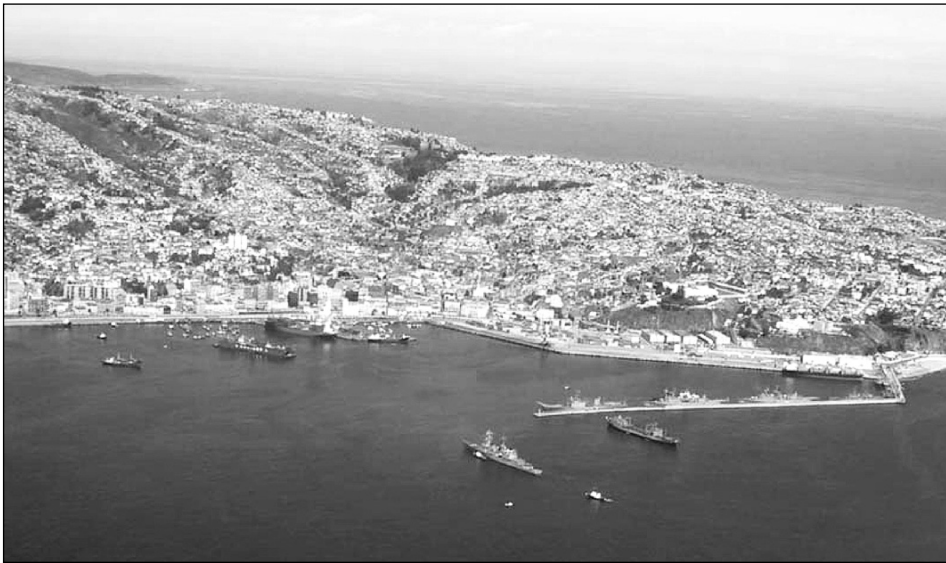
FOTO 2. El puerto de Valparaíso

Como su desarrollo urbano se caracteriza por la falta de espacio, las autoridades han realizado permanentes esfuerzos de relleno en espacios que inicialmente formaban parte del mar, en segundo término el proceso de poblamiento de los cerros ha sido sacrificando la cobertura vegetal, configurando una