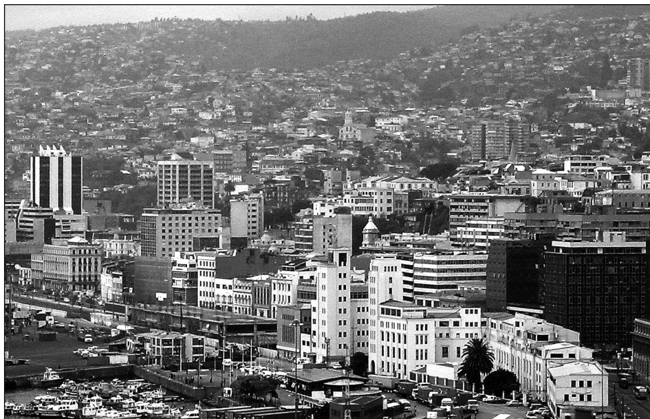
FOTO 3. Vista panorámica del área histórica

En el marco de los 200 Años del Municipio de Valparaíso 1791-1991 y como una actividad extraordinaria, para obtener una visión integral de las diversas problemáticas de la ciudad y visualizar vías de desarrollo, el Municipio de Valparaíso en el año 1991 convoca a un Cabildo ciudadano que marcará un hito en los lineamientos que seguirán en la protección del Patrimonio de la ciudad. Es así que como respuesta a la voluntad ciudadana expresada en el área de cultura de dicho Cabildo y las evaluaciones de los compromisos adquiridos en el año 1993, la autoridad comunal, en el año 1994 da inicio a los estudios tendientes a la protección del patrimonio arquitectónico-urbano a través de los instrumentos de planificación territorial, desarrollándose en el seno municipal los primeros Estudios Seccionales a nivel del país: Preservación de Inmuebles y Zonas de Conservación Histórica y Preservación de Vistas desde los Paseos Miradores. El área del Puerto constituye así dentro del escenario de la cuenca marítima, la primera etapa prioritaria con alto valor histórico, arquitectónico y urbano, reconocida y resguardada a través de una ordenanza, y de la cual se adquiere el compromiso de poner en valor (foto 3).