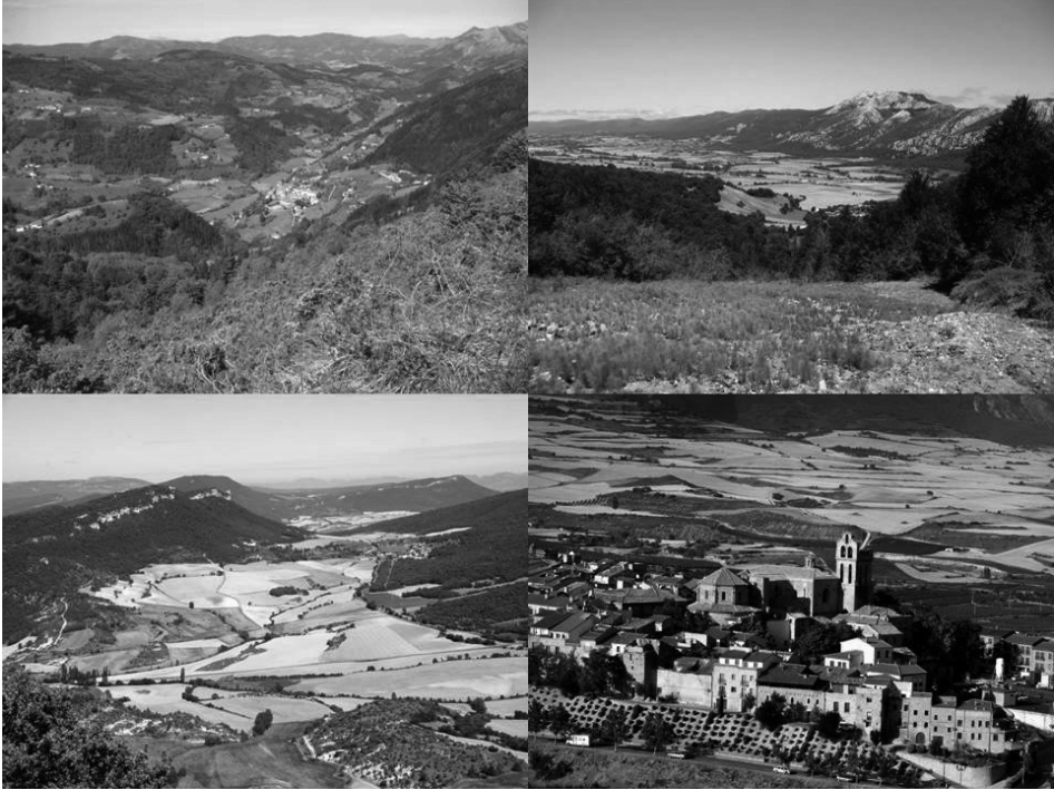
Comarcas de Tolosaldea, Llanada Alavesa, Valles Alaveses y Rioja Alavesa.

IMÁGENES DE LA DIVERSIDAD DE PAISAJES EN LA CAPV COMO RESULTADO DE LA ADAPTACIÓN ANTRÓPICA AL MEDIO.