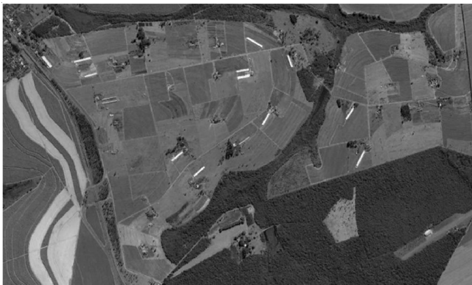
Figura 1 – Vista aérea do PA Horto de Bueno de Andrada.

integração com as agroindústrias avícolas (como pode ser visto na imagem abaixo). Como há famílias que construíram dois barracões, o total de granjas construídas chega a 14 em todo assentamento. A maioria das instalações tem capacidade para alojar entre 16.000 a 18.000 mil frangos, mas existem granjas com capacidade para alojar 25.000 mil aves. As granjas se distinguem não só pelo tamanho do barracão, mas também pelo grau de tecnificação dos equipamentos utilizados e pelo uso de mão de obra familiar. A pesquisa foi realizada através da aplicação de oito (8) entrevistas com os assentados integrados, com o representante do órgão gestor – ITESP e com o presidente da Associação dos Avicultores de Araraquara e Região, bem como a análise documental do contrato e do plano de recuperação judicial das agroindústrias estudadas.