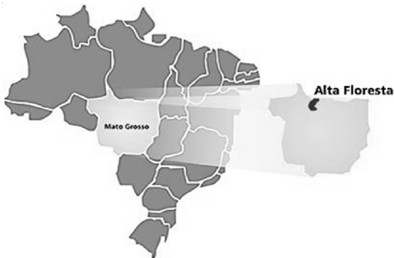
Figura 1 – Localização geográfica do município de Alta Floresta-MT.