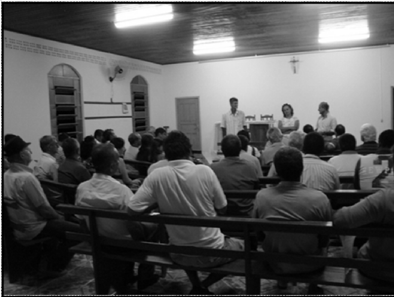
Foto: Reunião dos produtores com a Secretária de Meio Ambiente (centro) e Secretário de Agricultura (à esquerda) na comunidade Central em 01/02/2012. Alta Floresta-MT.

2013 de 18/01/2013 que instituiu o Programa Guardião de Águas, cujas normas e critérios serão definidos pela SECMA (ALTA FLORESTA, 2013). Espera-se que a normatização seja debatida com os agricultores conforme compromisso assumido pelos Secretários de Meio Ambiente e de Agricultura do município em reunião realizada na comunidade Central em fevereiro de 2012 com os produtores (Foto).