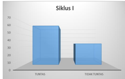
Grafik 1 Hasil Belajar Siklus 1

sejumlah 6 peserta didik atau 35%, seperti yang disajikan pada grafik berikut.