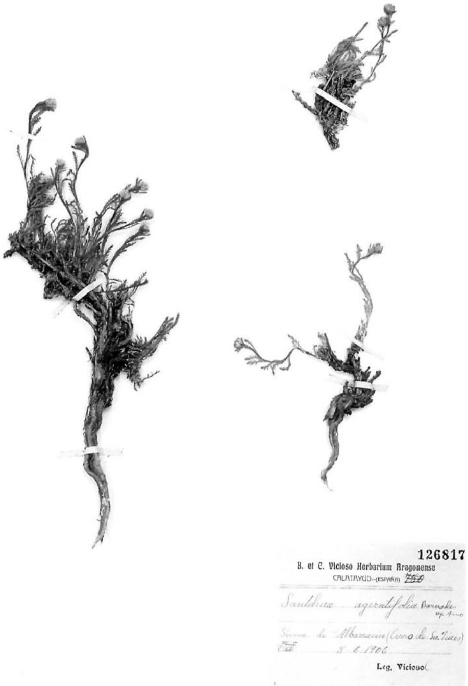
Fig. 3.—Material representativo de Santolina ageratifolia Barnades ex Asso.