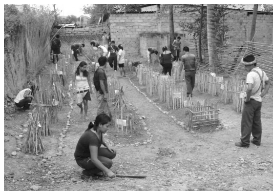
Foto 5. Huerto de plantas medicinales.