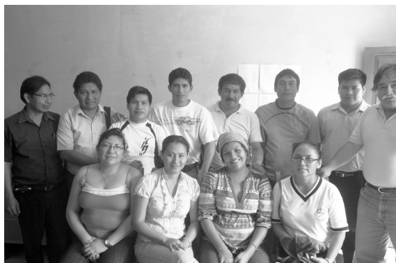
Fotos 13. Talleres con profesores de Bagua.

Al inicio y al final de cada semestre, la dirección del proyecto de formación de AIDSESP, en coordinación con el asesor pedagógico de cada PSI, diseñó talleres para fortalecer la capacidad de enseñanza superior de las y los docentes, así como su dominio del enfoque intercultural, de la enseñanza con indígenas y de la salud intercultural. Igualmente, los talleres buscaron reforzar la capacidad de evaluar a cada estudiante en función de sus capacidades y de su perfil de salida, según el nivel en el que se encontrara. Se organizaron 12 talleres de tres días.