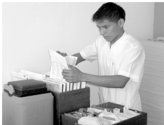
Foto 15. Estudiante haciendo prácticas en el Centro de Salud Nauta.

Parte del aprender-haciendo implicó que se establecieran prácticas para los cursos del área de salud. Con este objetivo, se firmaron convenios para que los establecimientos de salud próximos a los institutos se convirtieran en centros docentes. Las y los estudiantes —que acudían a los establecimientos supervisados por un docente encargado—, debían rotar por todos los servicios y desarrollar actividades en función de su nivel de formación; por ejemplo, durante el primer año, apoyo en los servicios de administración, triaje, farmacia, consultorio y emergencia.