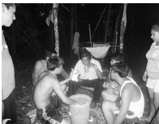
Foto 8. Estudiantes del ISTP de Nauta en la clase sobre tecnologías sanitarias indígenas.

En este sentido, la propuesta curricular contempla una revisión permanente de las competencias y un reajuste del plan curricular en función de la realidad en la cual los egresados se insertarían laboralmente, y en función de sus necesidades pedagógicas. En todos los semestres se incorporaron talleres, seminarios, actividades complementarias y se realizaron los reajustes curriculares respectivos para garantizar el logro de las competencias laborales.