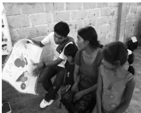
Foto 4. Atención a una comunidad.

En el PEI de Atalaya se afirma que «el Profesional-Técnico en Salud Intercultural Amazónico es un recurso humano cuyo desempeño debe desarrollarse en las comunidades indígenas de la Amazonía, donde la medicina occidental llega esporádicamente o no llega; y donde la población mantiene un concepto de salud enraizado en su cultura» (AIDSESP 2005: 7).