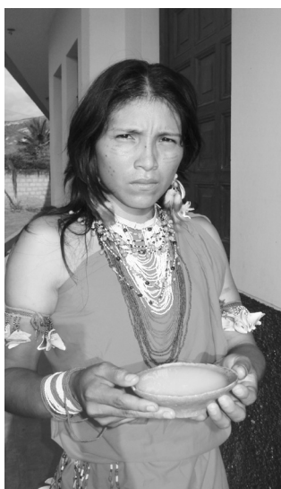
Foto 29. Enfermera técnica awajún del ISTEP de Bagua.

El trabajo de los enfermeros técnicos en salud intercultural amazónica contribuye a mejorar la calidad de la atención brindada a la población indígena, como producto de su formación en salud intercultural. Así lo evidencia un estudio del Instituto de Estudios Peruanos (IEP) sobre el aporte de los egresados del PFETSIA de Amazonas, que muestra, por ejemplo, que a partir de la contratación de un enfermero técnico en salud intercultural amazónica en el establecimiento de salud de una comunidad wampis, la cobertura en el área materna se incrementó «de un 65,0% en el año 2012 a un 105,0% en el 2013 y a un 80,0% en el 2014» (Chávez et ál. 2015: 5). A su vez, la investigación sobre el proyecto piloto de Atalaya realizada por Pesantes revela que las comunidades «están recibiendo un mejor servicio al tener trabajadores del sector salud que no discriminan contra los pueblos indígenas y sus prácticas culturales» (2014: 2).