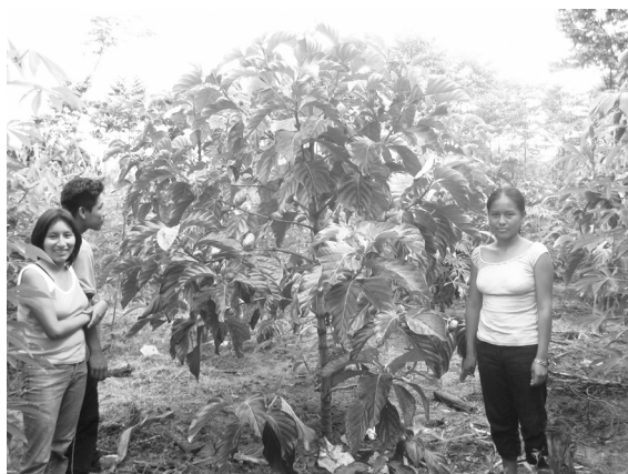
Foto 21. Estudiantes del ISTEP de Atalaya.

En cada experiencia de formación, un paso central fue conocer las características de los sistemas médicos indígenas y no imponer ni masificar prácticas. En la réplica de Nauta, por ejemplo, se organizó un encuentro de sabios indígenas para decidir qué aspectos de la medicina achuar se debían enseñar, quiénes serían los o las docentes, y cómo debían enseñar. En Bagua también se hizo un inventario primario de especialistas de medicinas indígenas, para conocer las principales prácticas de sus especialistas. Estas actividades tuvieron como finalidad aproximar a cada joven a los conocimientos médicos de sus pueblos, siempre considerando que no se están formando como curanderos. La idea central es que conozcan tecnologías sanitarias indígenas que no requieren especialización, pero que les permitirán atender enfermedades propias de los sistemas médicos indígenas, como el mal aire, susto, cutipa, o males como diarrea, tos, gripe.