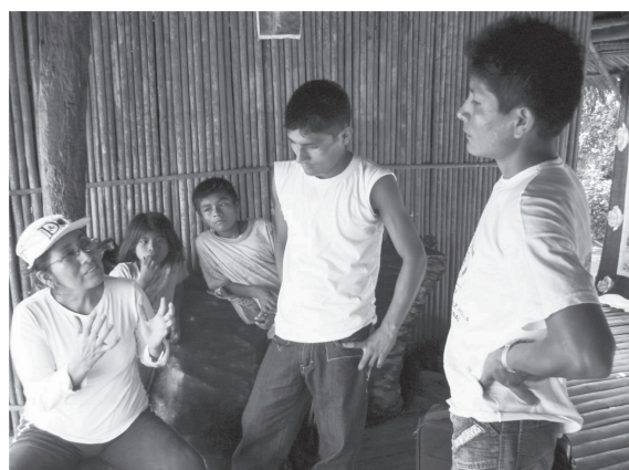
Foto 9. Alumnos en Bagua.

* Para información más detallada sobre el plan de estudios, véanse los PEI diseñados para las experiencias de Atalaya, Bagua y Nauta, de AIDSESP. Fuente: Proyecto Educativo Institucional Bagua, AIDSESP. Elaboración propia.