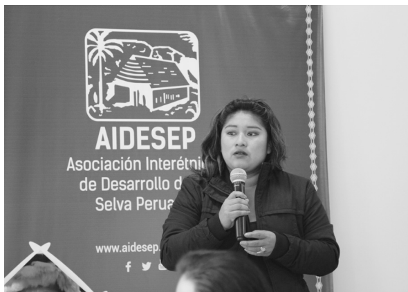
Foto 28: Dirigente nacional de AIDSESP da bienvenida a participantes del I Encuentro de Egresados de los PFETSIA de AIDSESP. Lima.

Todos los elementos descritos permiten tener una aproximación a la propuesta educativa de los PFETSIA. Además de reconocer estas características, consideramos relevante dar a conocer los logros, dificultades y desafíos de la propuesta de formación de AIDSESP, tanto en el ámbito político y educativo como en el campo de la salud. Presentamos a continuación algunas reflexiones en este sentido.