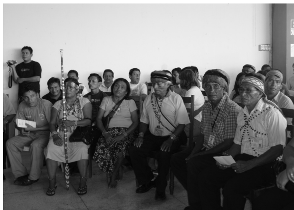
Foto 26: Dirigentes achuar de FECONACO en reunión con autoridades.