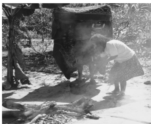
Foto 20. Maestra vaporadora dando clases en Atalaya.

Dentro del programa, las medicinas indígenas tuvieron el mismo valor cognoscitivo que la medicina occidental. Su incorporación no fue instrumental, es decir, no se subordinó al enfoque biomédico. Este reconocimiento de igualdad de los conocimientos se reflejó en la contratación de sabios indígenas como docentes, con el mismo sueldo que los otros. Si bien una de las dificultades para la contratación de sabios indígenas es que no poseen un título profesional, esto no se consideró un requisito pues queda claro que sus conocimientos responden a formas de validación no occidentales.