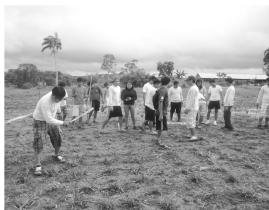
Foto 22. Estudiantes del ISTEP de Nauta.