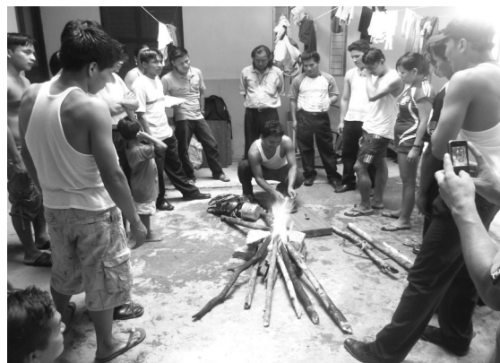
Fotos 11 y 12. Clases de los estudiantes en el ISTEP de Nauta.

Considerando estos aspectos, se intentó una mediación, un tránsito de la forma de aprendizaje indígena al modelo occidental analítico de aprendizaje. Para lograr este objetivo, la propuesta de formación tuvo en cuenta las estrategias que se detallan a continuación.