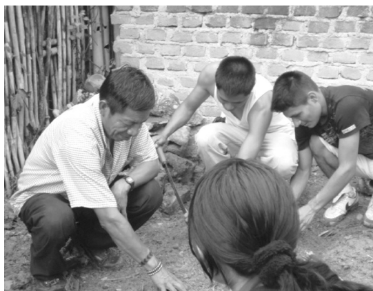
Fotos: 23 y 24. Enseñanza de medicina indígena en Bagua.

Todas estas diversas formas de percibir el proceso de salud-enfermedad-curación, así como los conocimientos y las tecnologías sanitarias que cada uno de estos pueblos desarrolla, se transmiten por pares y corresponden a enseñanzas familiares basadas en la observación y la experimentación. Algunas de estas enseñanzas son secretas y pertenecen solo al grupo familiar; estas se transmiten de padres o madres, abuelos o abuelas, a sus hijos o hijas, nietos o nietas. Sin embargo, los profesores indígenas consiguieron adaptar y tornar en colectivos estos procesos de formación individual, en parte porque las sesiones de enseñanza-aprendizaje de los conocimientos indígenas se centraron en los huertos de plantas medicinales y en la participación en sesiones de ayahuasca, espacios que permitieron a cada estudiante elaborar o consumir preparados de plantas medicinales como una de las principales formas de sensibilizarse y de aproximarse a los conocimientos y tecnologías de salud indígenas.