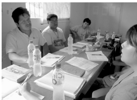
Foto 16. Reunión con dirigentes de ORPIAN-P.

Aparte de la evaluación académica, las y los dirigentes indígenas se reunían una vez por semestre para evaluar si sus estudiantes habían tenido un comportamiento acorde con los compromisos asumidos respecto a sus estudios, el reglamento interno del programa y el desarrollo de la identidad indígena. Una vez que la dirigencia recibía los informes, se establecían mecanismos y acciones para corregir los comportamientos considerados como poco aceptables. Esto ocurría cuando dirigentes, docentes y equipo técnico de AIDSESP coincidían en que la actitud hacia el estudio no estaba siendo la más adecuada. Además del respectivo «aconsejamiento», se necesitaba reforzar sus cuerpos, dejarlos más limpios para que el aprendizaje fuese más efectivo, lo que implicó medidas como la toma de vomitivos como el huancabisacha, el wayús o la ayahuasca. 13