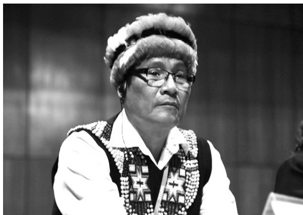
Foto 25: Presidente de AIDSESP 2005-2014.

En cada experiencia de formación se conformó un Consejo Asesor Indígena (CAI), integrado por los presidentes de las organizaciones de base. Su función fue supervisar el proyecto, opinar sobre las actividades desarrolladas y acompañar las gestiones frente a las instancias del Ministerio de Educación. El CAI se reunía dos veces por año y, en caso de emergencia, de forma extraordinaria.