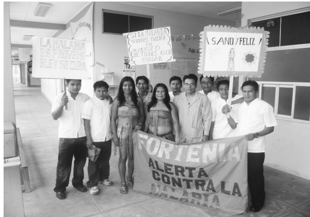
Foto 3. Enfermeros técnicos de Nauta.

Para cada experiencia del programa (Atalaya, Bagua y Nauta), el PSI-AIDSESEP elaboró proyectos educativos institucionales (PEI) que contenían los siguientes puntos: visión, misión, principios, objetivos, fundamentos, currículo, sistema de evaluación y forma de gestión de la propuesta de formación. Como AIDSESEP lo explica en el PEI-Bagua: