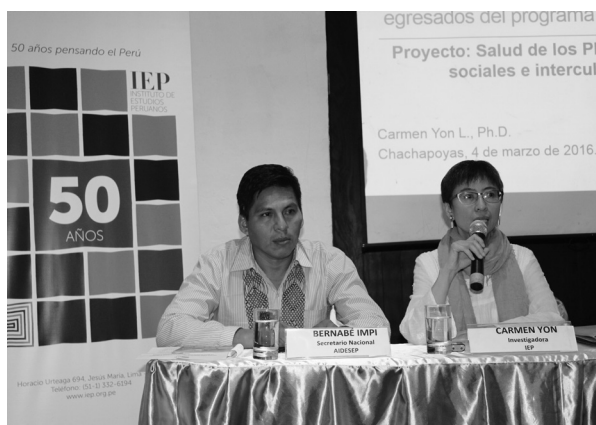
Foto 27: Dirigente nacional de AIDSESP en presentación de Estudio del IEP. Amazonas.