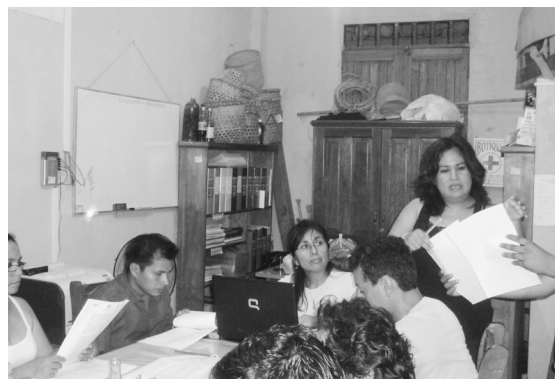
Foto 14. Trabajo pedagógico con docentes de Nauta.