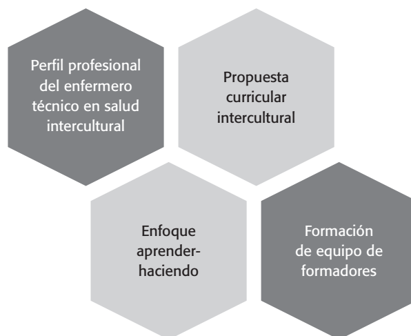
Gráfico 3. Componentes del modelo de formación de los Proyectos de Formación de Enfermeros Técnicos en Salud Intercultural Amazónica