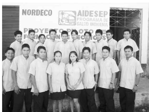
Foto 1. Enfermeros técnicos de Atalaya.

Una de las primeras preocupaciones del PSI-AIDSESEP fue el diseño de un currículo intercultural — mediante la diversificación y adecuación de la carrera de enfermería técnica—, que consiguiera tejer y articular los conocimientos de ambos sistemas médicos. Para ello, fue necesario contratar recursos humanos que desarrollaran estos conocimientos, y capacitarlos en estrategias pedagógicas para lograr una formación intercultural (por ejemplo, con talleres de educación intercultural dirigidos a docentes de los PFETSIA al inicio de cada semestre académico). Considerando estos aspectos, se diseñó una propuesta curricular, un modelo pedagógico de enseñanza-aprendizaje y un sistema de evaluación.