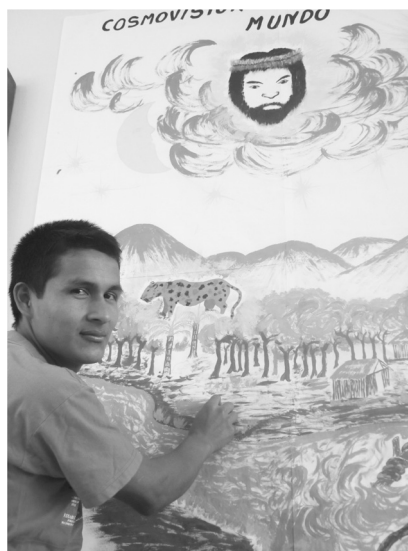
Foto 6. Clase sobre conocimientos indígenas.

El perfil profesional diseñado no es estático; por el contrario, durante las tres experiencias se fue alimentando de las lecciones que se iban aprendiendo en el camino. Así, se reformularon algunas competencias y se incorporaron otras, en función del contexto en el cual los egresados ejercerían su profesión. El objetivo: que el nuevo profesional cumpla su papel de bisagra entre ambos sistemas médicos. En total, se diseñaron 15 capacidades a ser alcanzadas progresivamente durante los tres años de formación (cuadro 1).