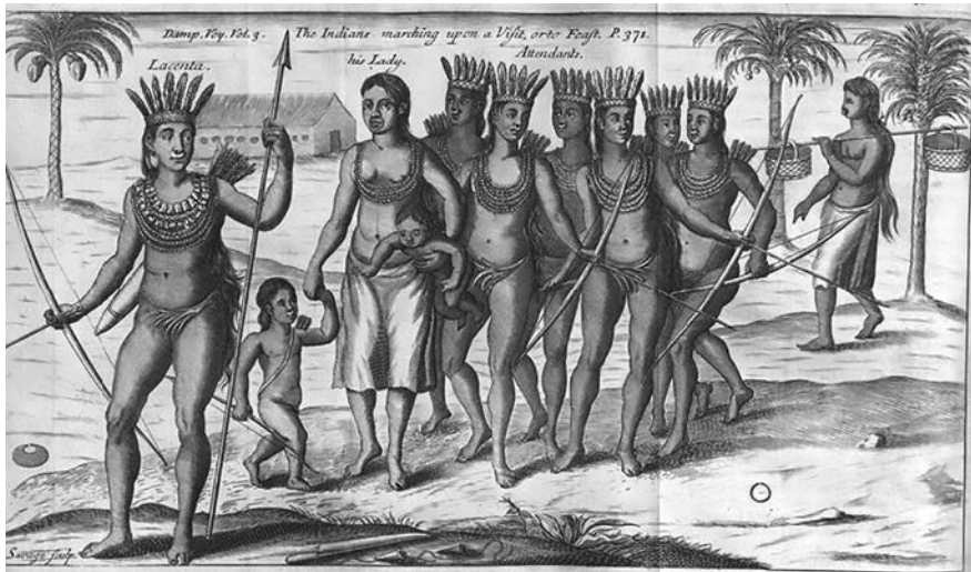
FIGURA 1. Tribu liderada por el indio Laconta. Los viajes de Lionel Wafer al istmo del Darién . Grabado. 1705.

estratégico y territorial en detrimento del dominio español en el Darién. 21 Por este motivo, los piratas británicos conocieron todo el territorio, pasos de selvas y ríos mejor que los propios españoles, ofreciendo noticias sobre la vulnerabilidad hispana en la zona ante un futuro plan de ataque.