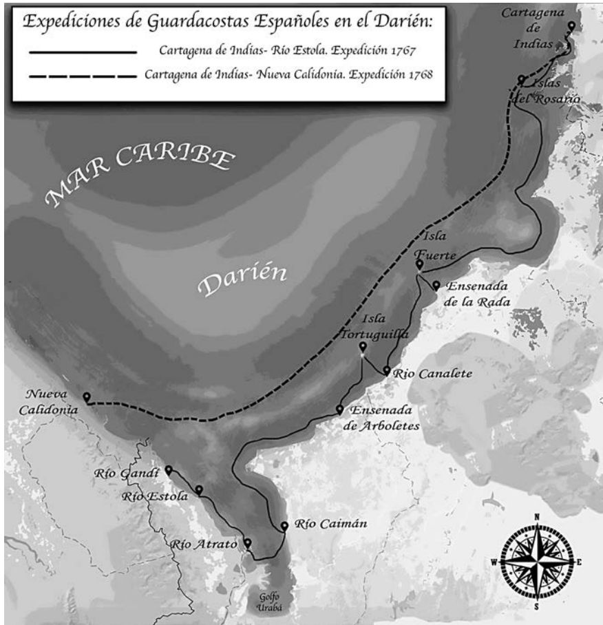
FIGURA 4. Mapa. Expediciones de guardacostas españoles en el Darién realizadas en 1767 y 1768.

numerosos accidentes geográficos que constituían una costa compleja, pues la sucesión de cabos y golfos ocultaba al enemigo. Tras partir de Cartagena de Indias, los barcos llegaron a la isla del Rosario dos días después a pesar de no haber demasiada distancia entre ambos puntos. Desde allí alcanzaron Isla Fuerte, donde se incorporaron las lanchas y las piraguas que transportaban el armamento. Al día siguiente, dichas embarcaciones fueron enviadas a reconocer la ensenada de la Rada y el río Canalete, para después volver