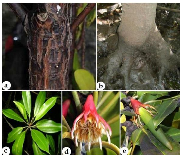
Gambar 1. Morfologi tumbuhan B. gymnorrhiza . a. batang, b. akar, c. daun, d. bunga, dan e. buah.

Saponin diklasifikasikan menjadi 2 kelompok yaitu: saponin steroid dan saponin triterpenoid. Saponin steroid tersusun atas inti steroid (C-27) dengan molekul karbohidrat, dapat dihidrolisis menghasilkan saraponin yang digunakan sebagai anti jamur dan dapat berkonjugasi dengan asam glukoronida. Saponin dapat digunakan sebagai bahan baku pada proses biosintesis obat kortikosteroid. Contoh senyawa saponin steroid diantaranya adalah asparagosides ( Asparagus officinalis ), avenocosides ( Avena sativa ), disogenin ( Dioscorea floribunda dan Trigonella foenum-graceum ). Saponin steroid banyak dijumpai pada tanaman Liliaceae , Amaryllidaceae dan Dioscoreaceae (Robinson, 1991). Saponin triterpenoid tersusun atas inti triterpenoid dengan molekul karbohidrat. Saponin jenis ini dapat dihidrolisis menghasilkan saponogenin. Saponogenin mudah