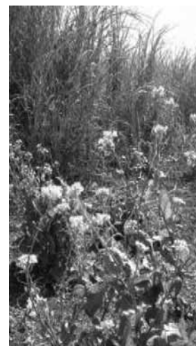
写真3 サトウキビ畑に自生するマーナ