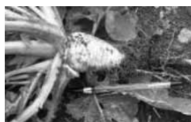
写真2 マーナの地下部