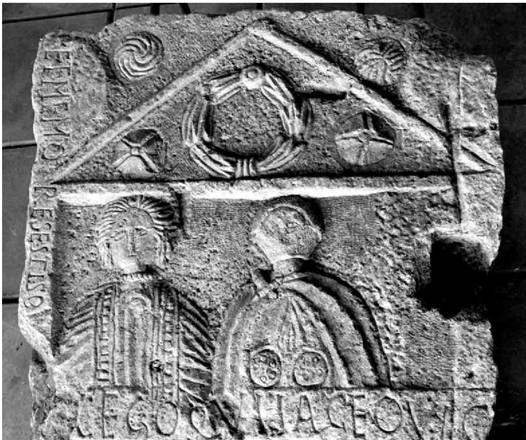
Fig. 4. Razgrad (Bulgaria), Abritus Museum – istoricheski muzey Abritus. Particolare della stele iscritta con l'inizio del verso 73 di Ovidio, Tristia , III, 3.

Anche in questo caso, come nei due precedenti, l'iscrizione si apre con le parole [ Hi]c ego qui iaceo , che riprendono testualmente l' incipit dell'epitaffio di Ovidio. E non solo: a questo attacco viene conferito un risalto del tutto particolare, dato che è stato inciso, con lettere di dimensioni molto maggiori rispetto a quelle delle altre righe (e come non pensare alle « grandibus in tituli marmore [...] notis » del v. 72 del carme di Ovidio?), nella fascia a rilievo che separa il registro con i ritratti dal sottostante specchio epigrafico (Fig. 4).