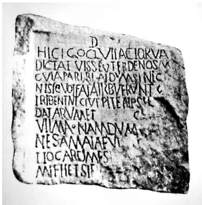
Fig. 2. La stele rinvenuta a Transmarisca (Tutrakan, Bulgaria) e oggi perduta con l'attacco del verso 73 di Ovidio, Tristia , III, 3 (da Conrad 2004, Taf. 119,3).

Inoltre, come accennavo all'inizio, questa iscrizione offre qualche interessante spunto di riflessione sulla ricezione della poesia di Ovidio nei formulari epigrafici, specie in ambito provinciale. Come hanno notato Paolo Cugusi e Maria Teresa Sblendorio Cugusi, la concordanza fra le prime righe di questa iscrizione e il verso 73 del carme di Ovidio «è significativa, dato che il poeta proprio a Tomis aveva passato parte della sua vita», 25 ma ancor più significativo è il fatto che i due dattili ovidiani compiano, sempre come incipit , su altri due monumenti funerari, provenienti sempre dalla Moesia Inferior e da località non molto distanti da Tomis .