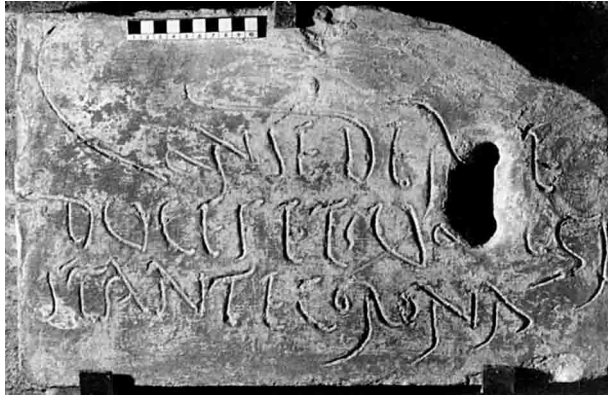
Fig. 6. Pinerolo (Torino), Museo Storico. Il mattone dalla fornace di Forum Vibii Caburum con il primo verso del libro XIII delle Metamorfosi (da Cresci Marrone 1996, fig. 1).

a esempio, ne fa un'irridente parafrasi), 44 ma che a stento si sarebbe portati a ritenere parte del bagaglio culturale di un umile figulus . 45