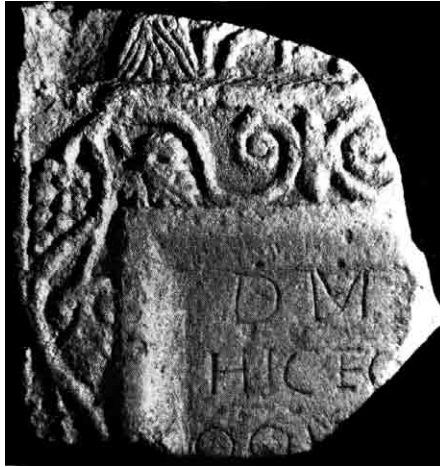
Fig. 1. Costanza (Romania), Muzeul de Istorie Națională și Arheologie. Il frammento di stele con l'attacco del verso 73 di Ovidio, Tristia , III, 3 (da Aricescu 1963, fig. 3).

timi anni della sua vita, si rinvenne casualmente l'ampio frammento di una stele sepolcrale in calcare locale ( Fig. 1 ), 2 con specchio epigrafico delimitato da una cornice a gola e listello e contornato all'esterno da tralci di vite, con pampini e grappoli alternati nelle anse dei girali. 3