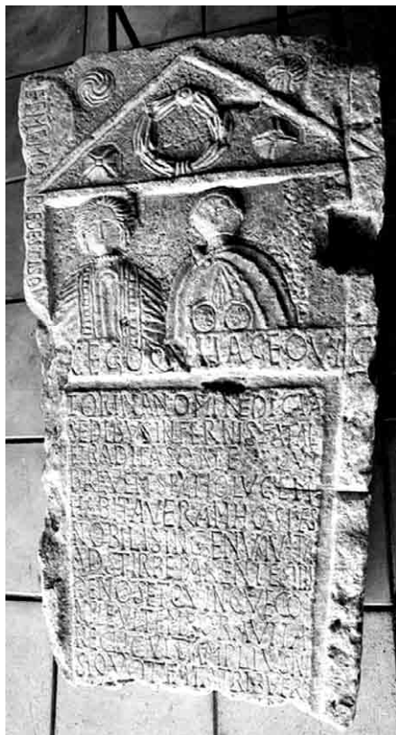
Fig. 3. Razgrad (Bulgaria), Abritus Museum – istoricheski muzey Abritus.

un uomo. 31 Il monumento è, almeno per ora, inedito, ma un'accurata scheda inserita presso la banca dati Ubi Erat Lupa (nr. 20853), 32 curata da Friederike Harl e corredata da quattro ottime fotografie, consente un'agevole esame dell'iscrizione, che qui, ovviamente, non trascriverò.