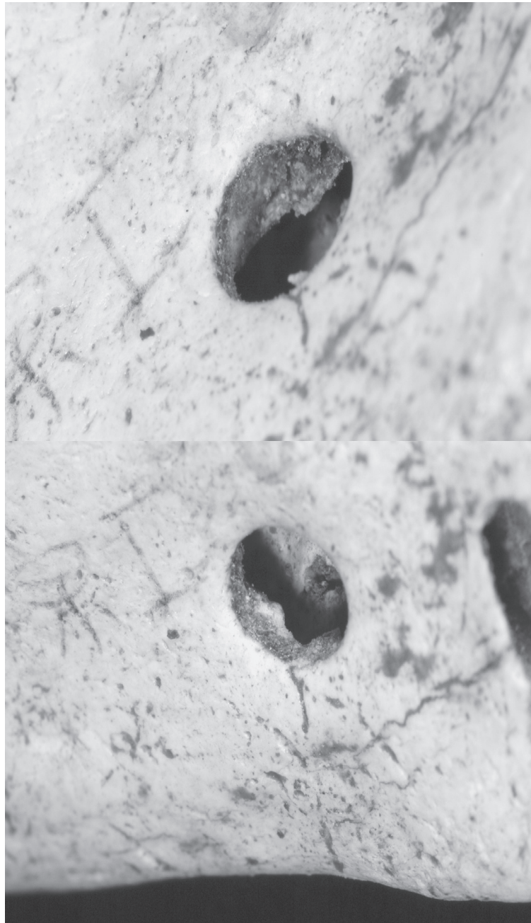
図3. 沖縄県読谷村 うふどうぼる 大当原貝塚出土下顎骨119 (性別不明・熟年) (貝塚時代後期 (弥生~平安時代相当期)) に認められた静止性骨空洞 (上: 右下顎角内面を下顎縁方向から撮影, 下: 右下顎部内面を下顎枝後縁方向から撮影)

現代人において、静止性骨空洞の発見頻度はそれほど稀ではない。日本では、江原ら (1977) は370人に1例、竹之下ら (1979) は約250人に1例の割合で観察できるという。大当原貝塚からは下顎骨119のほかに、同じ時代に所属する5例の下顎骨が発見されている。大当原貝塚に埋葬された人々の静止性骨空洞の出現頻度は16.7%ということになるが、実際はもっと低くなるはずである。性、年齢別には、従来の報告では男性が84%を占め、