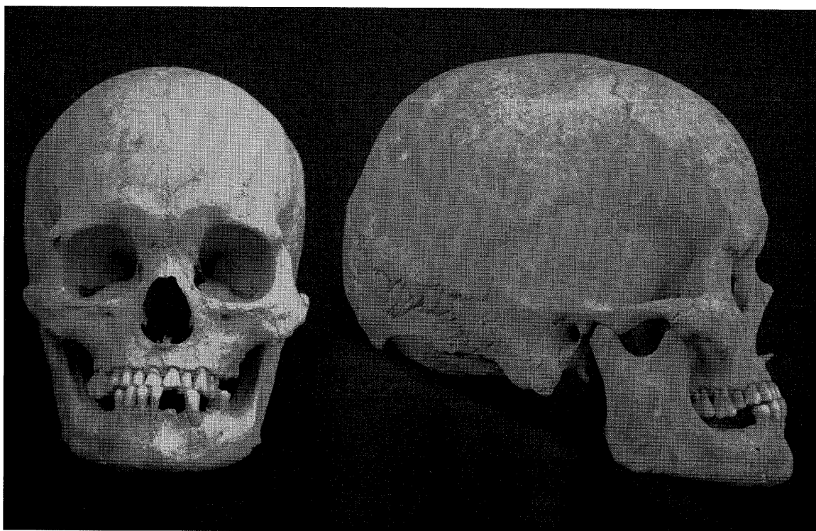
図1 おばま 小浜遺跡2004-1号墓出土中世人骨（男性・壮年）