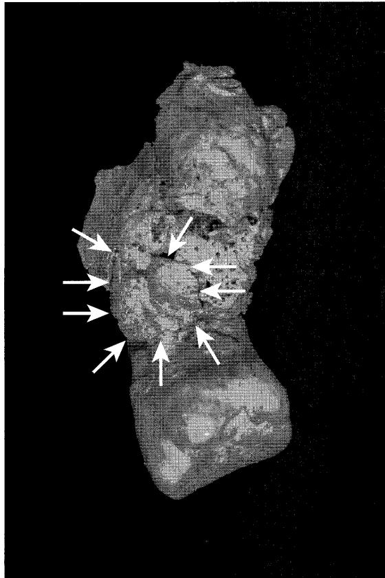
図4 おばま 小浜遺跡2004-1号墓出土中世人骨（男性・壮年）の上顎左第2大臼歯遠心面の歯根膨隆（矢印：膨隆）

セメント質腫はWHOによって、良性セメント芽細胞腫、セメント質形成性線維腫、根尖性セメント質異形成症、巨大型セメント質腫の4種類に分類されている。しかし、実際はかなり多様な病態を示し、いずれの型にも分類できない場合も少なくない（石川，1982）。