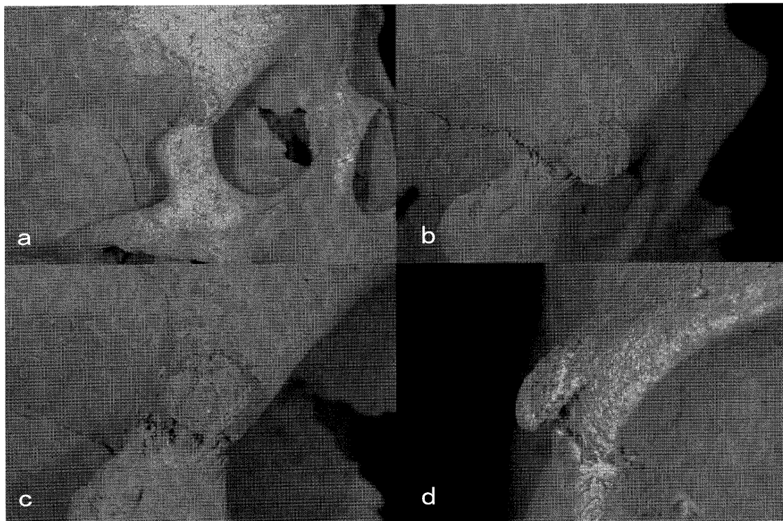
図2 おほま 小浜遺跡2004-1号墓出土中世人骨(男性・壮年)の前頭骨右頬骨突起端の骨膨隆 (a: 眼窩を含む右側面, b: 上方から撮影, c: 右側面から撮影, d: 正面から撮影)

部が外板から5 mmの骨膨隆が認められる(図2)。骨膨隆は周囲との境界は明瞭で、前頭頬骨縫合の8 mm上からはじまり、前下方に成長している。その成長の下端は前頭頬骨縫合を越え、頬骨に一部被さった状態である。骨膨隆の表面は粗造で、凹凸が目立つ。