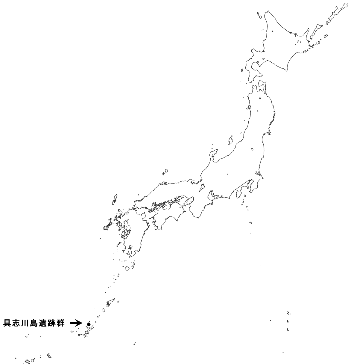
図1 沖縄県具志川島遺跡群の位置

研究を行った縄文時代人骨は、沖縄県立埋蔵文化財センターに保管されている沖縄県伊是名村具志川島遺跡群岩立地区遺跡 No44・46 下顎骨（性別不明・壮～熟年）である（図1）。本人骨は下顎のみが遺存していた。観察できた下顎の左右中切歯の歯槽中に根尖部歯根がそれぞれ遺存していた（図2）。