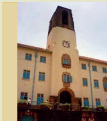
Tour de l'horloge de l'Université Makerere

L'Université Makerere, qui s'appelait la Makerere Technical School lors de sa création en 1922, est le plus ancien établissement d'enseignement supérieur de l'Ouganda. L'histoire de l'université a été marquée par de multiples changements — de son « âge d'or », à la fin des années 1960, en passant par les bouleversements politiques des années 1970 et 1980, jusqu'à une phase de récupération et de changement, amorcée durant les années 1990 et qui se poursuit aujourd'hui. Bien que