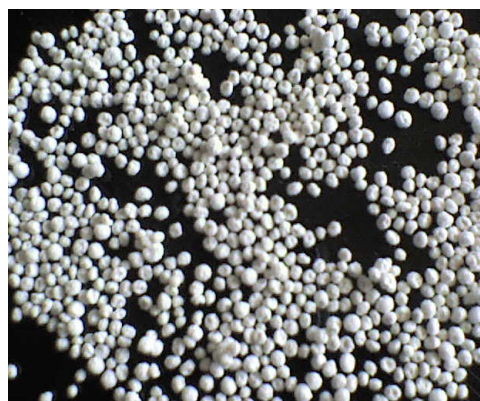
Figura 3. Microcápsulas de diclofenac secas.