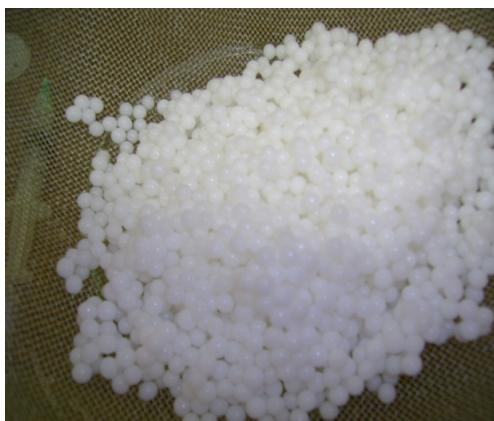
Figura 2. Microcápsulas de diclofenac recién preparadas.

El contenido de principio activo encontrado fue de 81.04 % \pm 0.93.