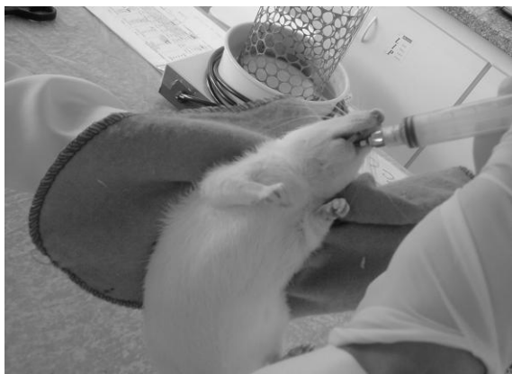
Figura 1 - Suplementação via orogástrica pelo método da gavagem.

Os protocolos de avaliação comportamental foram aplicados após o período de tratamento, momento em que os animais foram expostos, uma única vez, ao campo aberto no período noturno após as 19h30, devido a maior atividade da espécie, permanecendo no ambiente durante 3 minutos. No teste do labirinto em cruz elevado, o mesmo procedimento inicial foi aplicado, porém, o período experimental de observação foi de 5 minutos conforme o modelo descrito por Pellow, e colaboradores (1985). Comitê de Ética, protocolo 011/2006 da UFSCar.