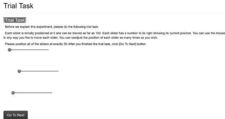
図 1: 被験者が操作するスライドバー

る実作業を行う。まず、移動させるスライド・バーの単位毎に、固定報酬額を定めておく。次に、この固定報酬額は被験者には知らせず、被験者に5単位毎の最低保証額を記入させる。最後に、ランダムにスライドバーを移動させる個数を決定し、そこにおける被験者の最低保証額がこちらの定めた固定報酬額より低い場合には実際に移動作業をしてもらい、固定報酬を与える。最低保証額が固定報酬よりも高い場合には、何ら報酬は与えず、実験は終了とする。こうした方法は、Becker-DeGroot-Marschak メカニズムとよばれる、被験者の留保効用を引き出すための実験手続きとして知られているものである (Becker et al. (1964))。この実験では、被験者は真実の最低保証額を申告することが