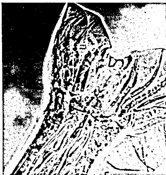
FIG. 3 - O. lyrata extremidade posterior do macho.