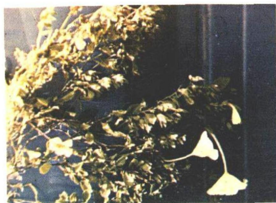
FIG. 3. Nierembergia veitchii que cresceu em um barrenco, protegida pelo pastoreio. Município de Piratini, Rio Grande do Sul.

Estudos epidemiológicos realizados mostraram que a calcemia, nos ovinos que estavam em áreas onde ocorria a calcinose, elevou-se acima dos níveis normais a partir do mês de outubro, mantendo-se alta até fevereiro e começando a diminuir, gradualmente, a partir de março (Riet-Correa et al. 1979a). A elevação dos níveis de cálcio sérico é coincidente com a época em que a planta, devido ao seu ciclo biológico anual, encontra-se nos poteiros.